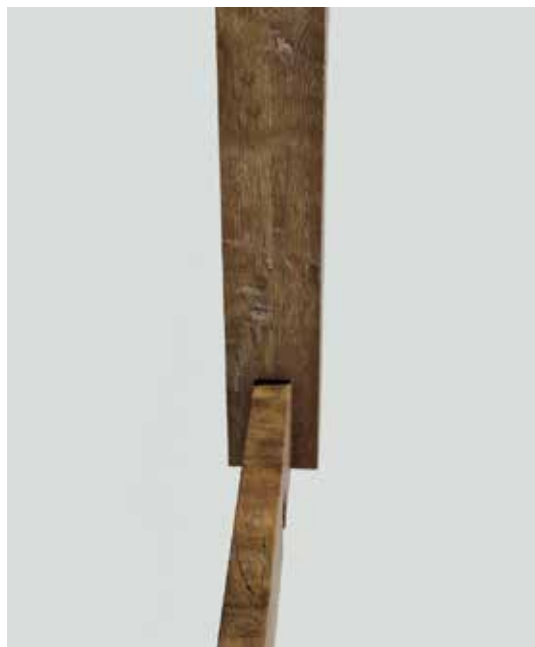
Fig. 15 – Un pilier de la tortue de Vitruve

D'autres protections plus légères disposées autour et à l'avant de la machine pourraient permettre de résoudre ce problème. La différence de taille des antennes entre la description d'Athénée et celle de Vitruve peut s'expliquer de plusieurs manières : plus les antennes sont grandes, plus le nombre de couples d'attelages est important et renforce la stabilité. Mais cette longueur peut également devenir un handicap à la progression de la tortue : les roues n'étant pas disposées sur les extrémités des machines, la présence d'une dénivellation trop abrupte peut faire obstacle à ces antennes, qui ne s'élèveront pas tant que les roues n'auront pas atteint l'obstacle. Cette rupture de pente peut atteindre les 19,5 degrés pour la tortue d'Athénée et jusqu'à 33 degrés pour celle de Vitruve.