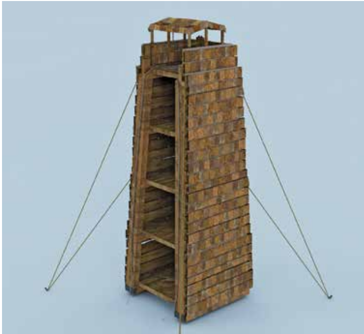
Fig. 4 – La tour de siège d'Apollodore de Damas