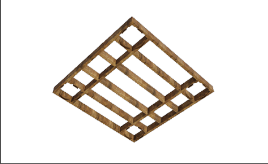
Fig. 6 – Base des tortues