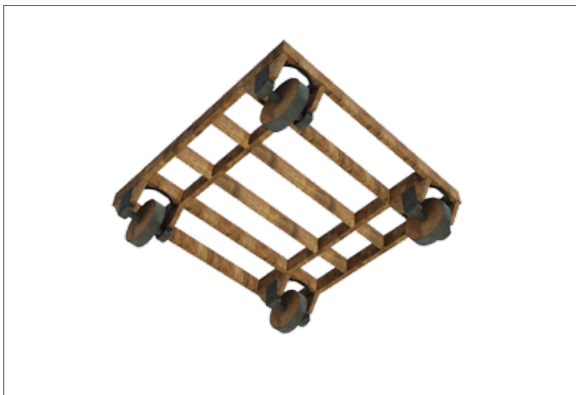
Fig. 11 – Les roues de la tortue de terrassiers