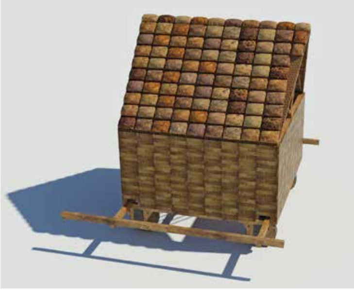
Fig. 3 – La tortue « de mineurs » d'Athénée