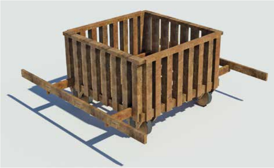
Fig. 8 – Les piliers formant la « cage » des tortues

Vitruve formule des choix différents qui sont vraisemblablement dus à leur expérience. Pour une même machine, il est d'usage de ne retrouver qu'une seule section de pièce pour les différents éléments des machines, les piliers de la tortue de Vitruve faisant figure d'exception. Cette normalisation apparente des pièces laisse supposer une préparation en amont et ces textes auraient un objectif commun : permettre de préparer les pièces maîtresses des machines avant le siège, voire avant le début de la campagne militaire.