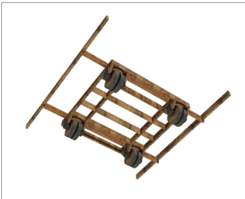
Fig. 12 – Les roues de la tortue « fortin »