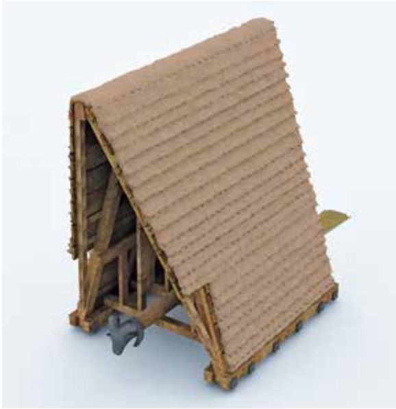
Fig. 5 – Le bélier d'Apollodore de Damas

un rapport adapté à chaque machine. Par exemple, Apollodore de Damas estime que la section des poutres du bélier n'est pas suffisante pour les poutres de la tour et il ajoute 0,25 p d'épaisseur pour compenser le poids plus important qu'elles supportent.