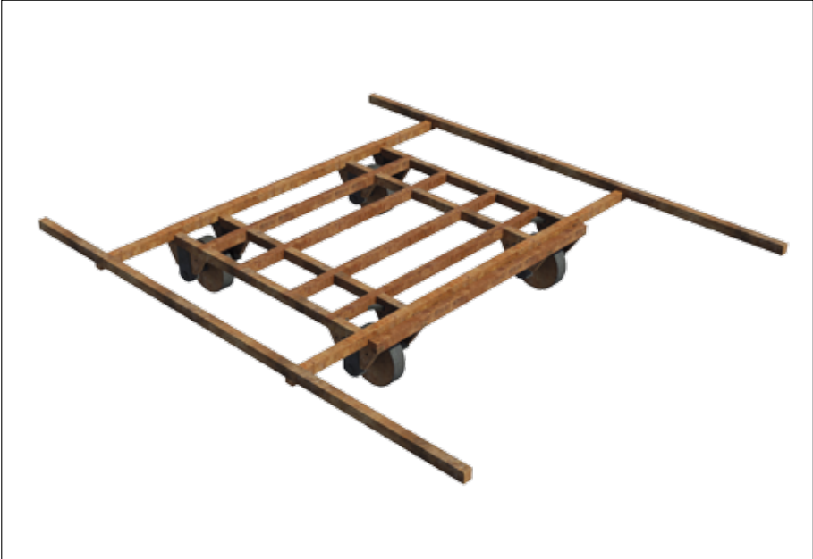
Fig. 7 – Les « antennes » sur la tortue d'Athénée