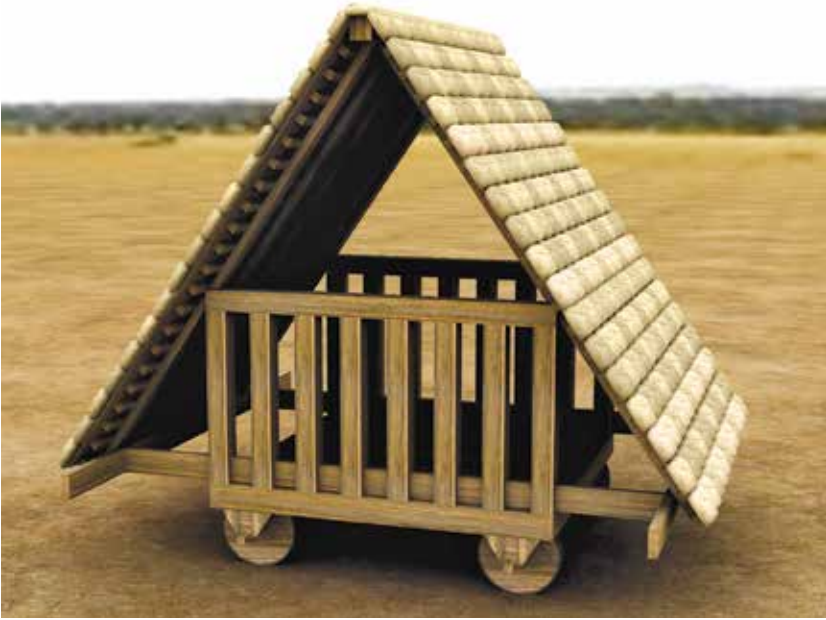
Fig. 13 – La tortue de terrassiers selon P. Fleury et S. Madeleine