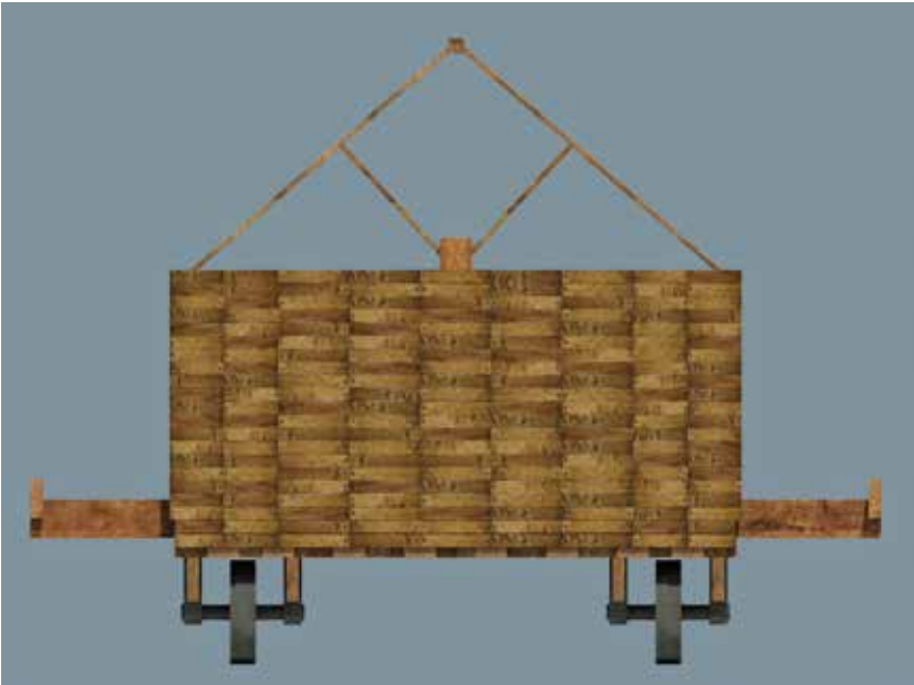
Fig. 14 – Vue de profil du toit de la tortue de terrassiers