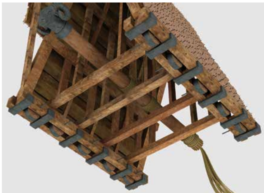
Fig. 10 – Les roues du bélier d’Apollodore de Damas