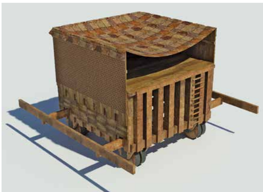
Fig. 2 – La tortue «fortin» de Vitruve