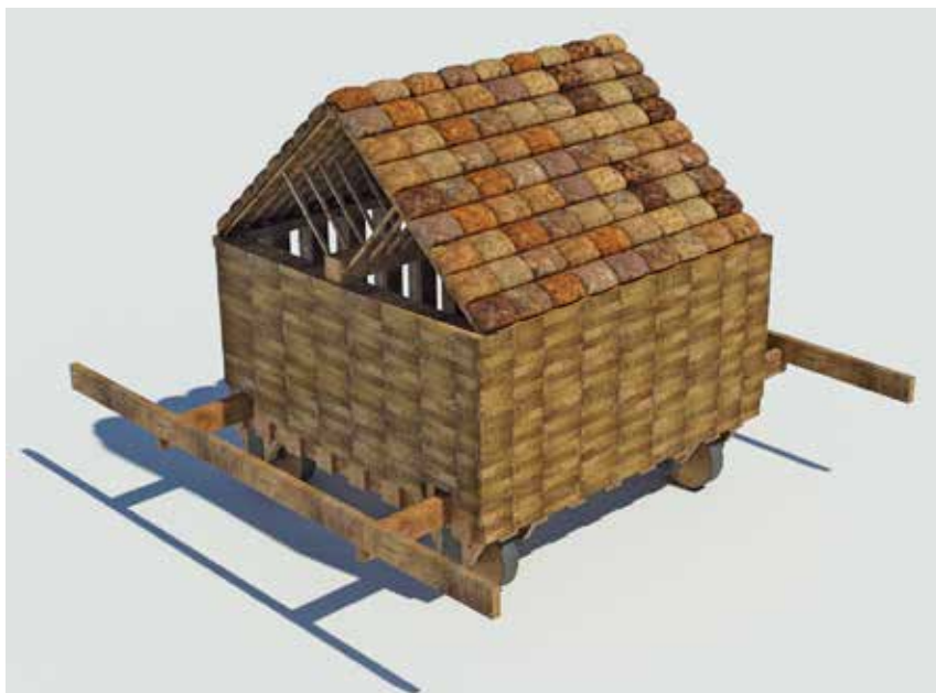
Fig. 1 – La tortue «de terrassiers» de Vitruve