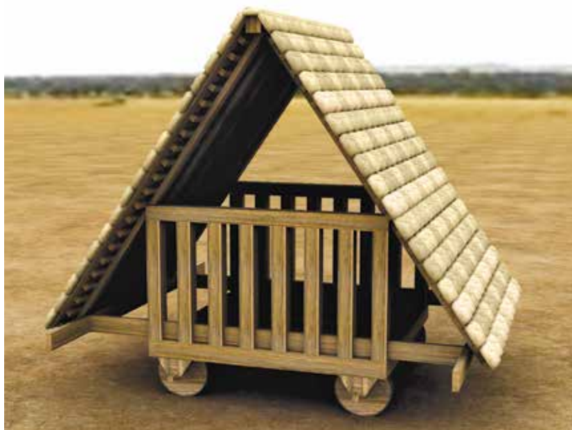
Fig. 13 – La tortue de terrassiers selon P. Fleury et S. Madeleine