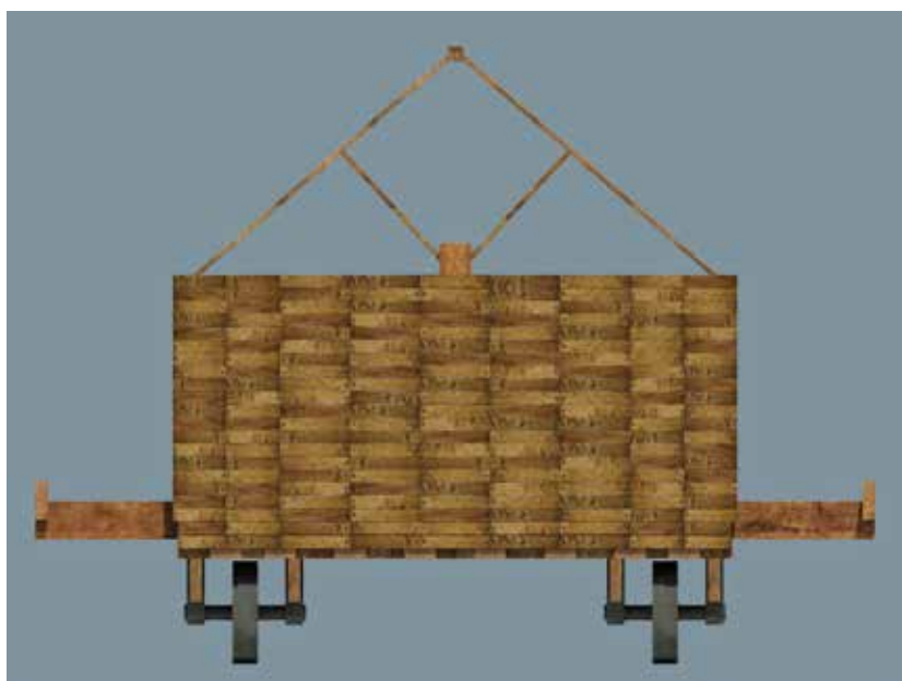
Fig. 14 – Vue de profil du toit de la tortue de terrassiers