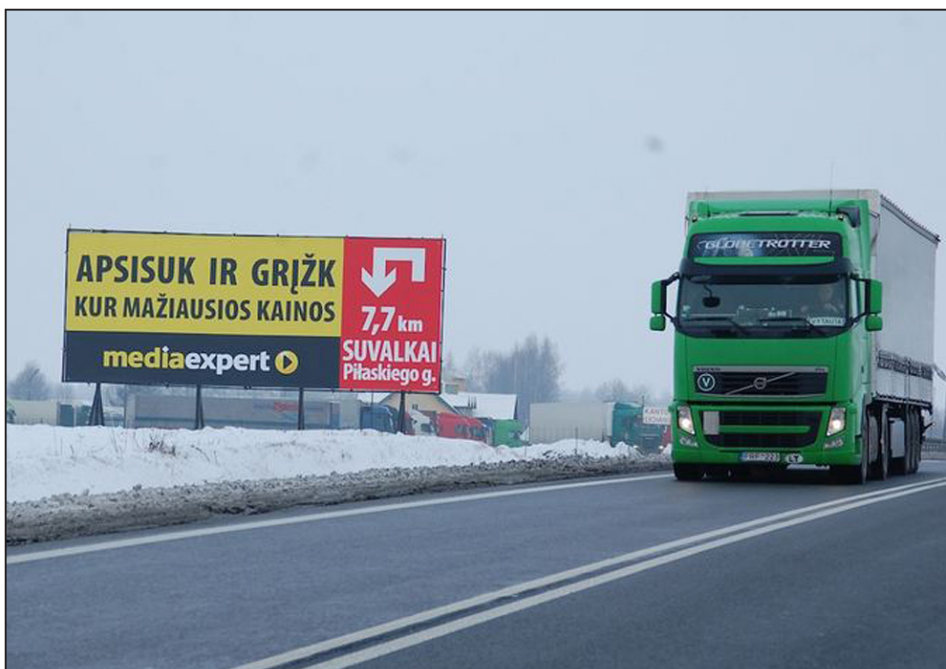
Photo 1 : Publicité sur la route frontalière entre Pologne et Lituanie : « Fais demi-tour et reviens là où les prix sont les plus bas »