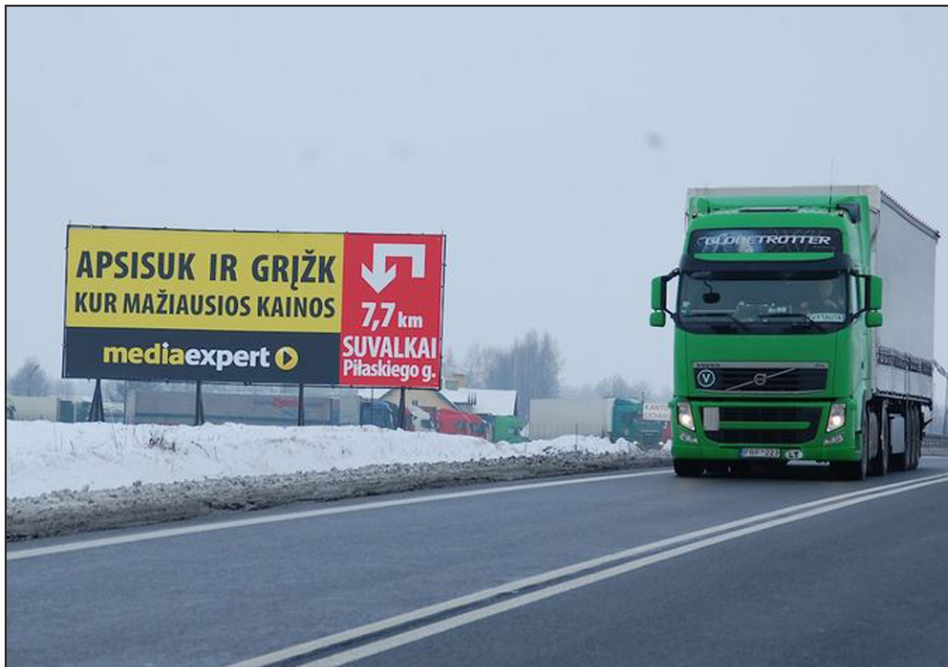
Photo 1 : Publicité sur la route frontalière entre Pologne et Lituanie : « Fais demi-tour et reviens là où les prix sont les plus bas »