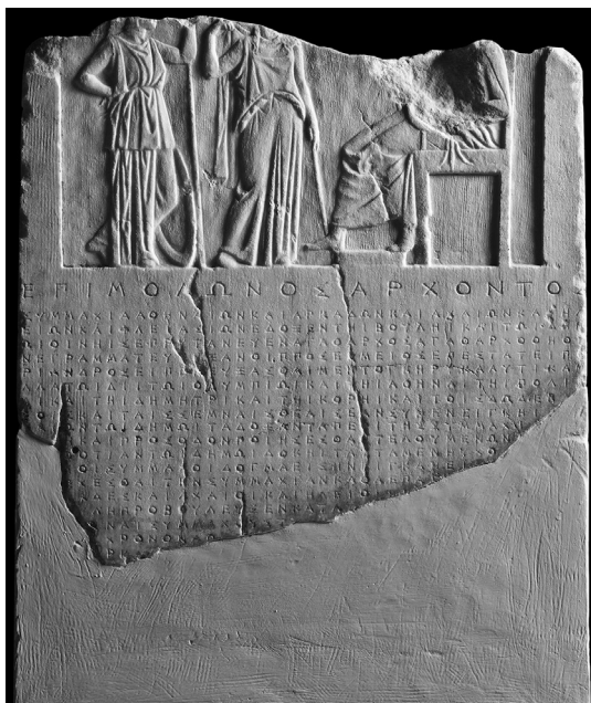
Fig. 2 – Athènes et les cités et territoires du Péloponnèse. Musée de l'Acropole, inv. NAM 1481, IG II 2 112