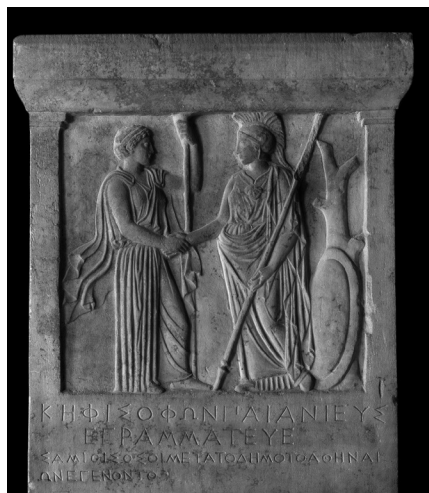
Fig. 5 – Athènes et Samos, Musée de l'Acropole, Akr. 1333 (détail)

Le relief de l'ensemble est moins prononcé que pour le premier en-tête, de sorte que l'on peut bien là reconnaître deux artistes et deux styles différents. Les deux en-têtes mettent en scène trois personnages, dont deux féminins et un masculin. Dans les deux cas les personnages féminins sont debout, tandis que le personnage masculin est assis. L'absence de toute « étiquette » 14 nous empêche ici de pouvoir les identifier avec certitude. Il faut donc s'appuyer sur une analyse iconographique de la composition d'ensemble, de l'apparence physique des personnages et en particulier de leurs attributs. À l'extrême droite du premier en-tête ( fig. 3 ), un personnage casqué se tient debout, la tête ainsi que le bras droit baissés, le gauche relevé, et fait face aux deux autres personnages, qui occupent l'espace de gauche du relief. De son bras gauche, ce personnage féminin semble s'appuyer sur un objet, vraisemblablement une lance, qui était peinte à l'origine, de même que le bras droit baissé devait tenir un bouclier peint 15 . Sur le second en-tête ( fig. 4 ), le personnage féminin figuré tout à gauche de la composition adopte une posture similaire, le bras gauche appuyé sur une lance, sculptée cette fois, et le bras droit plié, appuyé sur sa hanche gauche. Le haut de son visage a disparu, mais elle portait peut-être également un casque.