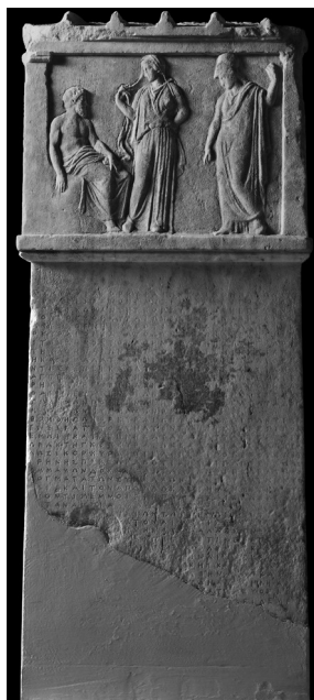
Fig. 1 – Athènes et Corcyre. Musée de l'Acropole, inv. NAM 1467, IG II 2 97