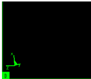
Figure 4: Exemple de champ de température en régime stabilisé dans du 304L.

L'ensemble des travaux réalisés en terme de maillage et de programmation numérique ont permis d'obtenir les champs de température en régime stabilisé dans la pièce et l'outil ainsi que les champs de contraintes infligés à la matière de la pièce au niveau des bandes de cisaillement. La figure suivante (Figure 4) est un exemple de champs de température obtenus en régime stabilisé.