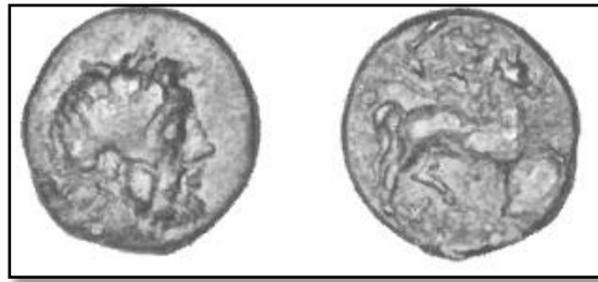
Fig. 1. Monnaie de Chôma (Lycie), I er s. av. J.-C. 7 Droit : tête laurée de Zeus ; au revers : Kakasbos, sur un cheval, une massue brandie dans la main droite.

En Pisidie, tout comme en Lycie et en Pamphylie occidentale, territoire précédemment louvitophone, un culte était voué à un dieu cavalier à la massue du nom de Kakasbos. Les représentations de ce dieu datent de l'époque gréco-romaine. Ce dieu est toujours représenté à cheval, qui est l'un de ses deux attributs avec la massue comme nous le montre par exemple une monnaie de Chôma (fig. 1) 6 .