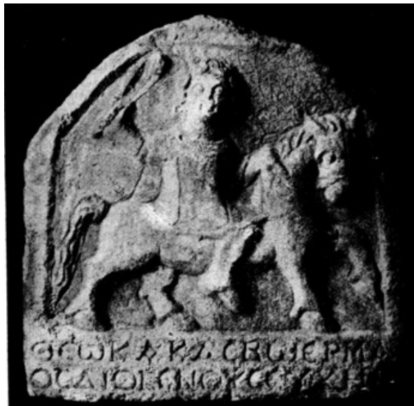
Fig. 2. Relief représentant Kakasbos 11 .

La massue est l'élément qui permet de le différencier des autres dieux représentés à cheval quand il s'agit de stèles anépigraphes. Il est important de le distinguer de Sôzôn qui, lui, tient une bipenne, c'est-à-dire une hache à double tranchant. Sa massue lui vaudra d'être assimilé à Héraklès 8 . Cependant, seul son nom fera l'objet d'une interpretatio Graeca et il continuera à être représenté sur un cheval en mouvement, brandissant sa massue 9 . Cette assimilation est surtout visible à Telmessos et sur le haut plateau pisidien 10 .