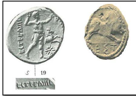
Fig. 4. À gauche 27 , revers d'une monnaie avec le nom de la cité en toutes lettres, un frondeur et un protomé de cheval issant.

Sur la monnaie de droite (revers) 28 , la forme abrégée en trois lettres du nom de la cité, en dessous d'un sanglier.