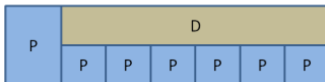
Figure 8 : proposition de nouveau scénario d'hybridation de la formation UE TICE et métiers {P= activités en présence/activités à distance}

La représentation du scénario d'hybridation s'exprime par un schéma d'alternance simplifié. Le projet se construit à distance parallèlement à un ensemble d'activités en présence visant à le nourrir et l'alimenter sur les axes de la conception, de la veille, du juridique, etc.