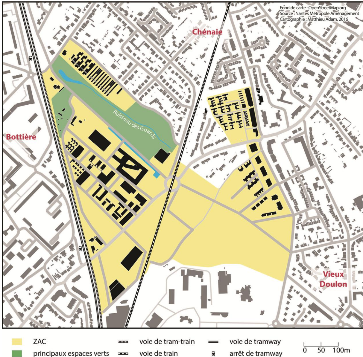
Carte 2. Plan de Bottière-Chénaie en 2013

Renouveler l'image de ces territoires, notamment grâce au DUD et à la mixité sociale, afin de les rendre désirables pour des investisseurs et des promoteurs et pour une population plus jeune et plus aisée est un objectif explicite des destinataires et concepteurs des projets.