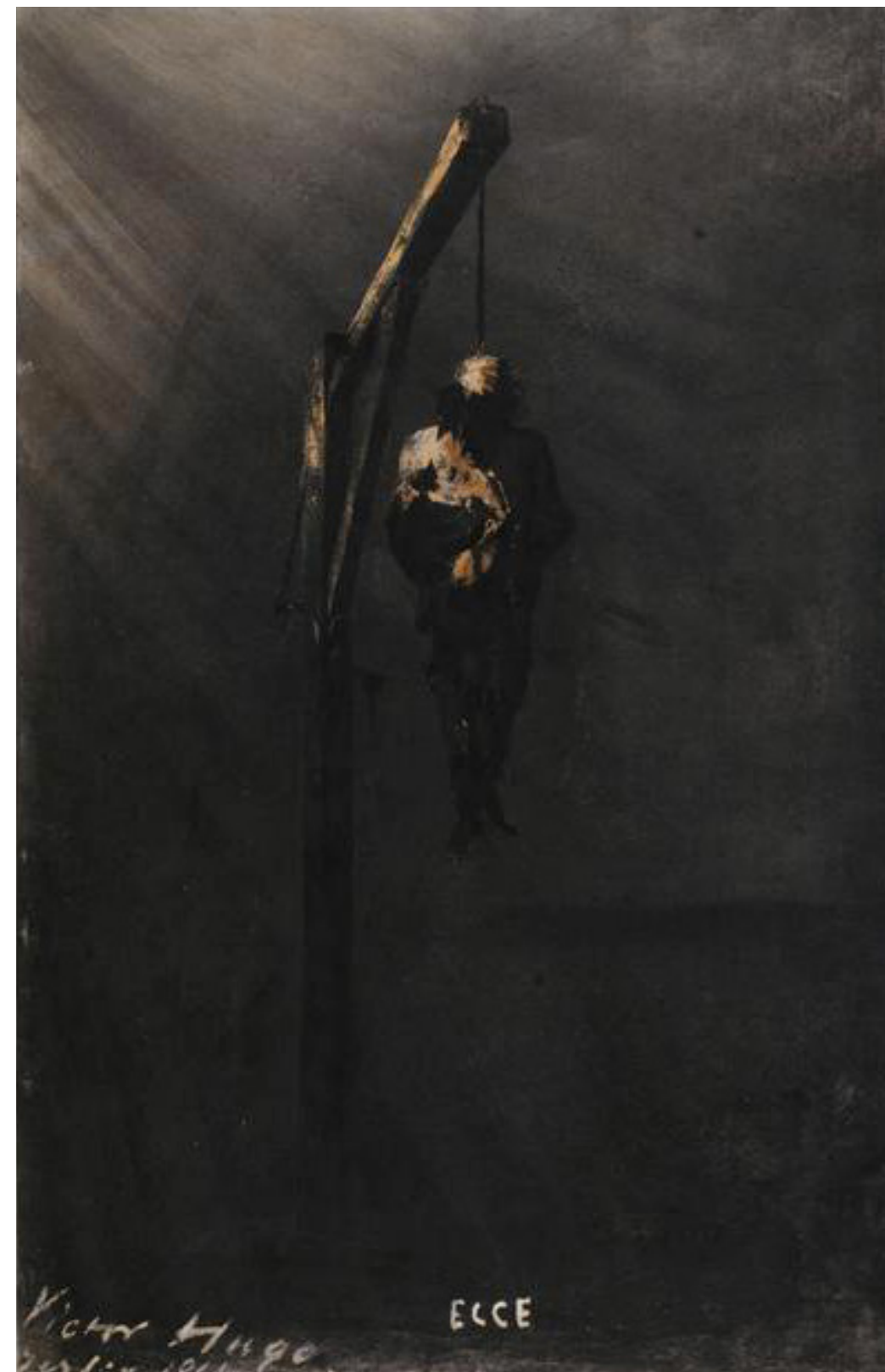
Victor Hugo, Homme pendu à un gibet , vers 1854. Dessin, lavis brun avec rehauts de blanc, 52,4 × 33,8 cm, musée du Louvre.

L'esthétique romantique de la violence s'affirme aussi bien au théâtre, dans le roman et dans la poésie que dans des textes plus théoriques – essais médicaux, juridiques ou historiques, sans compter les articles de la Gazette des tribunaux qui ont inspiré tant d'écrivains romantiques (Stendhal pour Le Rouge et le Noir , 1830 ; Victor Hugo pour Claude Gueux , 1834). Elle ne peut donc se circonscrire à un seul genre ou à quelques auteurs, elle innerve et informe aussi bien le roman social ou historique que les récits fantastiques, aussi bien les œuvres qui mettent le réel en perspective que celles qui offrent des échappées oniriques. Le romantisme, qui se pense comme une esthétique de la totalité, brasse les genres, les sciences, les connaissances ; en ce sens, il ne peut laisser de côté aucune forme de violence, collective ou privée. Il s'agit de tout embrasser, de tout exposer, jusqu'à la laideur puisque, comme le synthétise Hugo dans la « Préface » de Cromwell (1827), si « le beau n'a qu'un type, le laid en a mille ».