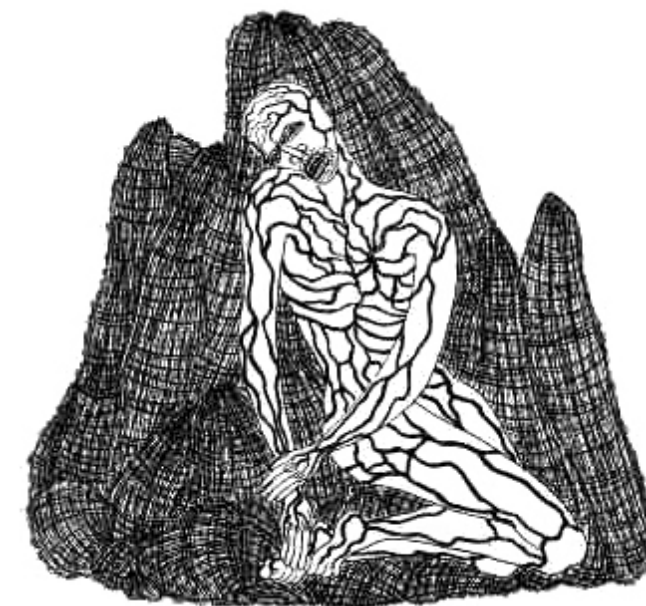
Jacques Houplain (graveur), La Falaise , 1947. Extrait de : Lautréamont, Chants de Maldoror , Société des Francs-Bibliophiles.

C'est « le coucher du soleil romantique » (Baudelaire), c'est l'ironie d'un Flaubert qui a exploité toutes les ressources