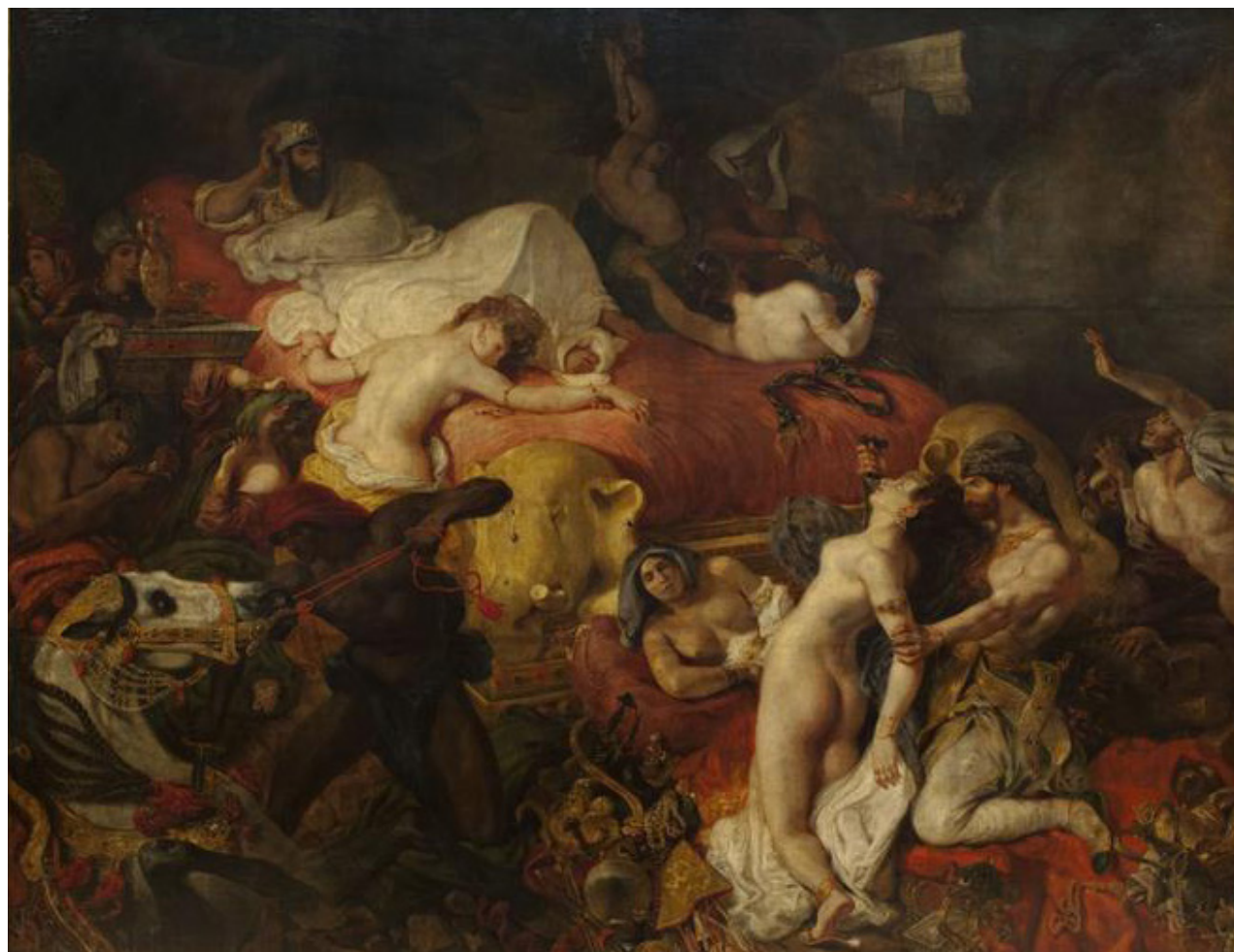
Eugène Delacroix, La Mort de Sardanapale , 1827. Huile sur toile, 392 x 496 cm, musée du Louvre.

littérature, liée non seulement à une sensibilité historique et à un renouveau thématique, mais plus largement à un renouvellement du goût. Le criminel ou la femme meurtrière sont mis sur le devant de la scène romanesque, théâtrale ou poétique. Dans la lignée de Thomas de Quincey ( De l'assassinat considéré comme un des beaux-arts , 1854), ils apparaissent comme des figures d'artistes romantiques, portant comme l'écrivain un regard de dévoilement sur le monde et la société, depuis ses coulisses et ses marges. Instrument de liberté et de rébellion, personnage paradoxal et fascinant, le criminel sert une redéfinition de l'héroïsme, puisé dans la grandeur du mal. Il incarne un sublime de la révolte et de l'énergie. En somme, il tient tout autant de Satan, dans son rapport au savoir et à la connaissance, de Prométhée, dans sa volonté de reculer les limites imposées à l'homme comme à l'artiste, que de Lucifer, dans sa beauté terrifiante. Les actes meurtriers sont, pour le romantisme, des arts poétiques, des créations artistiques, le crime est une distinction, une aristocratie d'un nouveau genre. Enfin, la féminisation croissante du personnage au cours du siècle illustre les liens de la transgression et de la volupté, de la beauté et de la mort, de l'érotisme et du mal.