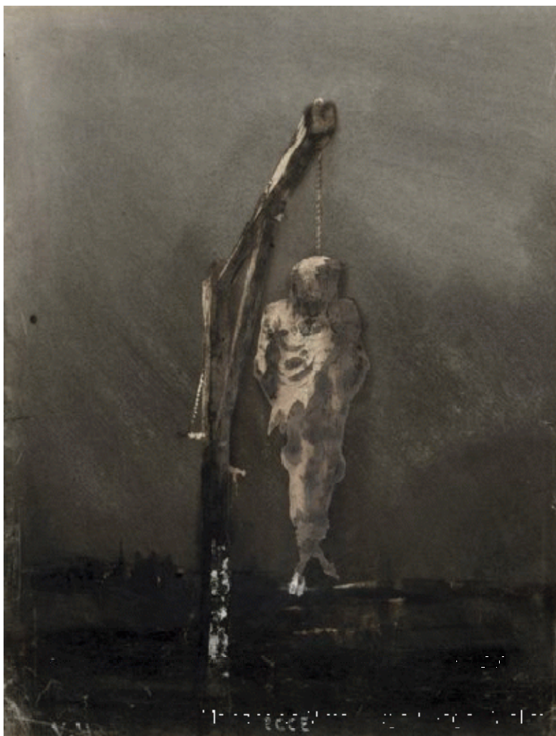
Victor Hugo, Ecce, le pendu (1854)

La représentation de meurtres, d'assassinats, de crimes, de corps mutilés, blessés, saignants répond à une esthétique du choc, de l'effet à produire. Une lecture sereine et passive est refusée au lecteur, qui doit investir son imaginaire, ses fantasmes, pour répondre aux scènes qui lui sont offertes. Mis en position d'insécurité, de voyeurisme, il est sans cesse sollicité, par la mise en abyme d'une fascination qui touche l'auteur comme les personnages du récit, relais du désir et miroirs de la curiosité, du dégoût ou de la fascination que ces tableaux se doivent d'exercer. Comme l'écrit Philippe Sollers dans un essai sur L'Écriture et l'expérience des limites , consacré en particulier à une lecture du texte sadien, l'œuvre confronte le lecteur aux limites du représentable, par les thèmes choisis — l'érotisme, le meurtre, la transgression — mais aussi par un mode de représentation qui oscille entre monstration et non-dit, exhibition et voilement. « Le langage [est un] mouvement d'oscillation entre deux pôles jamais atteints [...], celui d'une opacité infranchissable, et celui, symétrique, d'une transparence absolue 1 ». C'est entre ces deux pôles que prend place le désir transgressif du lecteur, lien de la violence et de la