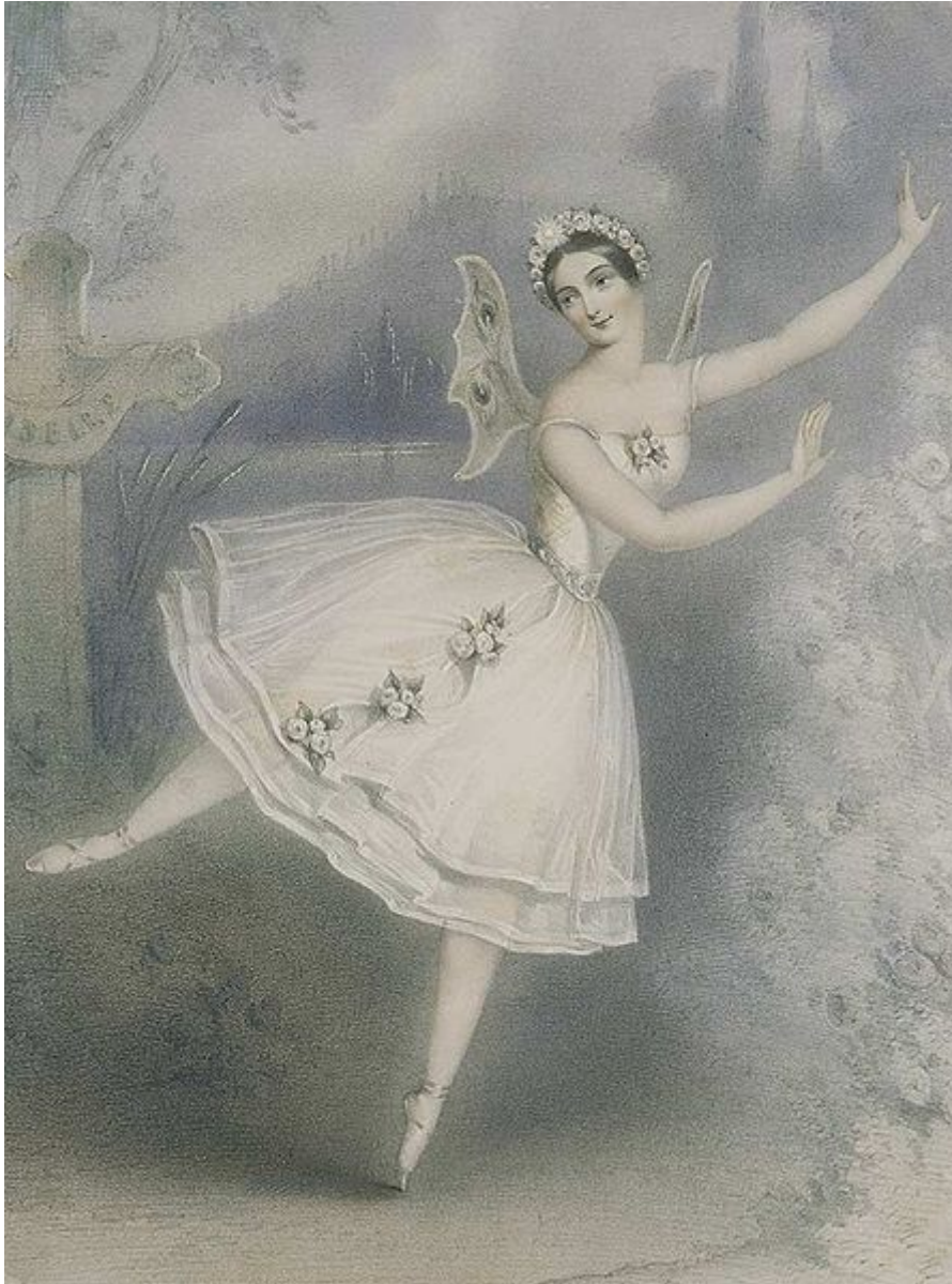
Carlotta Grisi dans Giselle , 1841

Le développement des machineries et des éclairages transforme la scène en espace d'illusion et en espace ouvert. Des personnages apparaissent et disparaissent par des trappes, comme Giselle de sa tombe, tandis que les esprits aériens tournoient dans les cintres. La sylphide s'envole par la cheminée au premier acte ; au second, une douzaine de ses sœurs vole en ronde. Le public retient son souffle quand Carlotta Grisi se jette du haut d'un nuage dans les bras de Lucien Petipa, dans La Péri . La technologie devient un élément esthétique, et l'imagination règne. Les innovations majeures concernent l'éclairage. Le gaz, utilisé pour la première fois à l'Opéra en