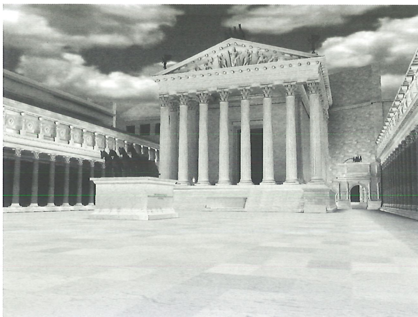
FIG. 2 : Le forum d'Auguste

Université de Caen Basse-Normandie, CNRS, Plan de Rome (France)