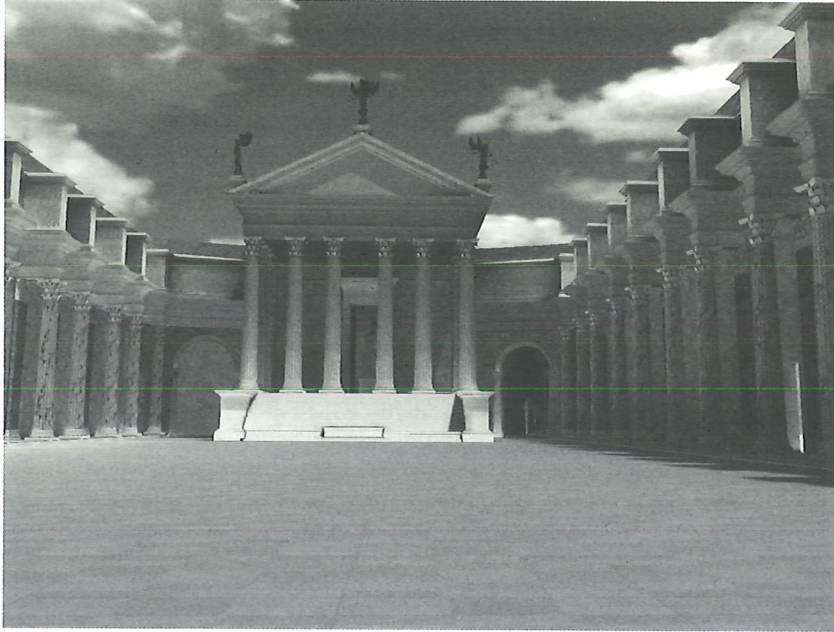
FIG. 4 : Le forum de Nerva

Université de Caen BasseNormandie, CNRS, Plan de Rome (France)