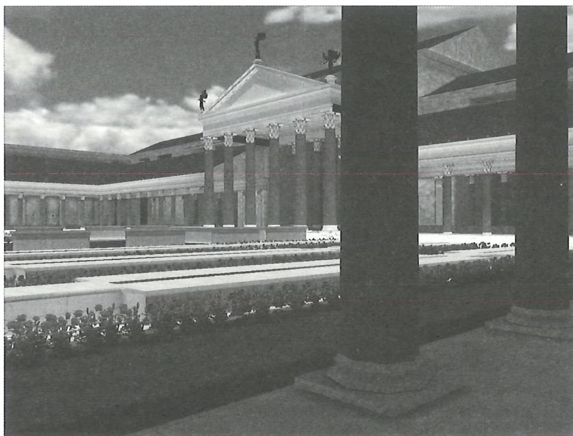
FIG. 3 : Le forum de Vespasien Université de Caen Basse-Normandie, CNRS, Plan de Rome (France)

Le forum de Vespasien (fig. 3) n'a jamais porté ce nom dans l'Antiquité. Les auteurs latins parlent de forum Pacis 31 (« forum de la Paix ») ou encore de templum 32 / aedes 33 Pacis (« temple de la Paix »). Les auteurs grecs disent τὸ φόρον Εἰρήνης (= calque de forum Pacis ) 34 , τὸ τῆς Εἰρήνης τέμενος 35 , τὸ ἱερόν τῆς Εἰρήνης 36 , voire même tout simplement τὸ Εἰρηναῖον 37 (« sanctuaire de la Paix »). Érigé par Vespasien après son triomphe sur la Judée en 71 p.C., il fut inauguré en 75 p.C. et prit la place d'un macellum incendié en 64 p.C. Avec ses jardins et l'absence de haut podium pour le temple, il est atypique dans la série des fora impériaux