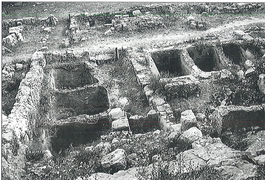
Fig. 3 – Bassins pour la macération du poisson, Lixus – Maroc

cation du garum sont toujours visibles au nord du Maroc (fig. 3), au sud de l'Espagne et... en Bretagne. Le marché d'Ostie conserve deux belles boutiques de poissonniers à l'entrée et sur celui de Pompéi, on a retrouvé divers restes de poissons dans les évacuations. En Normandie le site de Vieux a livré un grand nombre de vestiges osseux de poissons 29 : plusieurs milliers (dont 5 366 déterminés) dans un seul puits qui a servi de dépotoir à divers moments de l'occupation du site. La majeure partie des ossements de poissons datent de la seconde moitié du IV e siècle p. C. Douze espèces différentes ont été identifiées : turbot, pageot, mullet, cabillaud, merlan, vieille, congre, grondin, aiguillette, raie bouclée, daurade grise et surtout plie (ou carrelet) qui représente presque 98 % des échantillons.