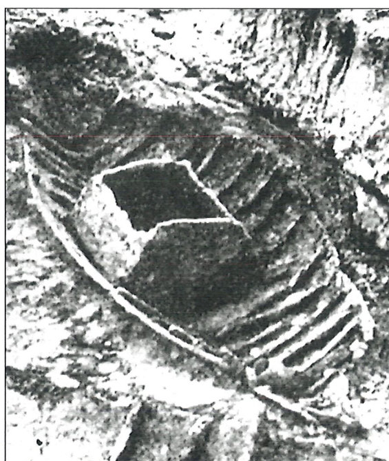
Fig. 2 – Barque de pêche avec vivier (II e siècle p. C.) au moment de sa découverte à Ostie (P.-A. GIANFROTTA, « Archeologia subacquea e testimonianze di pesca », MEFRA, 111, 1999, 1, p. 9-36)

L'archéologie enfin nous livre divers témoignages sur les nourritures de la mer dans l'Antiquité, de la barque de pêche au marché. Dans l'ancien port d'Ostie a été retrouvée une remarquable barque de pêche équipée d'un vivier ( fig. 2 ). Des viviers en maçonnerie ont également été retrouvés dans des villas. Des bassins de fabri-