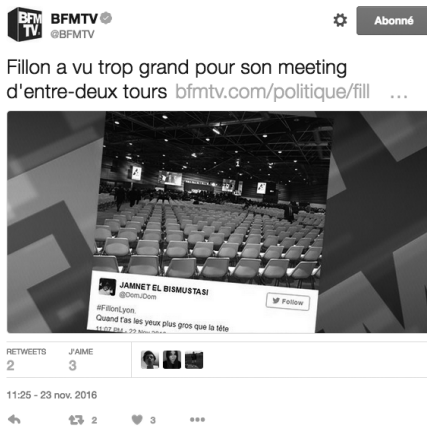
Doc. 6 : Tweet de BFM TV à propos du meeting de François Fillon à Lyon le 22 novembre 2016

le second tour. Avec 66,5 % des voix, François Fillon devient l'incontestable candidat de la droite à la présidentielle de 2017. Il n'en a pas moins commis quelques « erreurs » dans sa stratégie meeting. Habitué aux campagnes nationales, il a fait une mauvaise évaluation de son public en choisissant une capacité de salle bien trop ambitieuse pour une campagne de Primaire. Les journalistes de BFM TV n'ont pas manqué de souligner, notamment à l'antenne, le manque de jugement du candidat qui « a vu trop grand » pour son meeting à Lyon le 22 novembre (doc. 6).