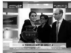
Doc. 3 : Dramaturgie de l'accès au direct