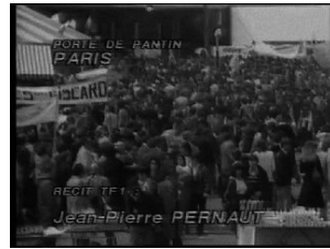
Doc. 2 : Vue aérienne du meeting de V. Giscard d'Estaing, Porte de Pantin, 3 mai 1981 (JT 20 h, TF1)

Le récit journalistique des comptes rendus de meeting se construit en inversant les codes narratifs alors usités. Jusqu'en 1974, les verbatim des candidats constituaient l'ossature du reportage (les extraits de discours pouvant durer 2 ou 3 minutes). Désormais, le récit de meeting s'articule autour d'un commentaire journalistique jalonné de verbatim raccourcis du candidat. Surtout le meeting devient un objet en soi, capable de susciter un intérêt spécifique chez les journalistes au-delà du seul compte rendu politique. Ainsi, après avoir relaté les enjeux stratégiques – rassemblement et unité de la droite – du