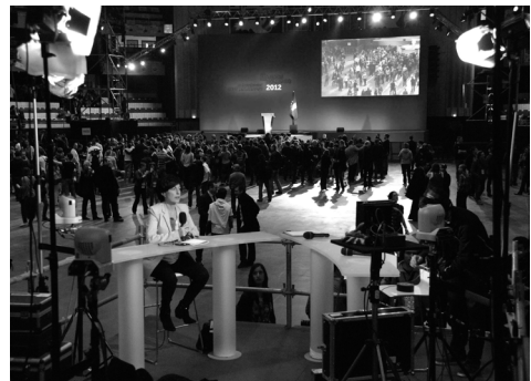
Doc. 4 : Plateau de BFM TV – Meeting de François Hollande à Lyon (1 er mars 2012).

demande d'accréditations au meeting de Jean-Luc Mélenchon à Lyon et Paris (version hologramme), les journalistes doivent remplir un formulaire (Google Forms) pour préciser s'ils ont besoin : d'un boîtier audio (nécessaire aux journalistes radio pour récupérer une source audio du discours à la tribune), d'un signal vidéo (nécessaire aux journalistes TV pour récupérer les images de la production audiovisuelle), l'accès Wifi (indispensable à tous les journalistes pour finaliser et envoyer leur papier à la fin du meeting), un car satellite ou un point de Stand up (pour faire des direct caméra avant, pendant ou après le meeting).