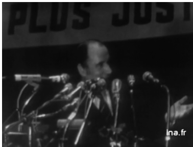
Doc 1 : L'orateur non télégénique (de gauche à droite : 1965, 1969 et 1974)