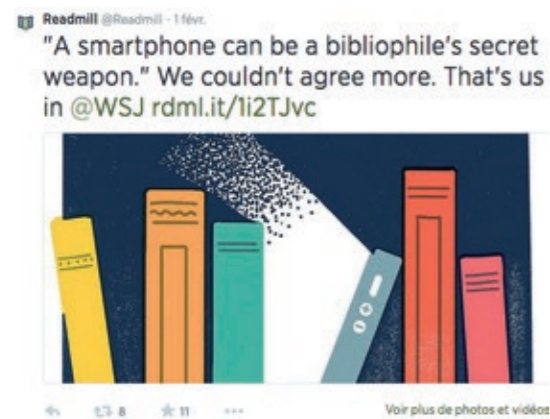
Le smartphone, « arme ultime » du bibliophile pour Readmill 19

les uns par rapport aux autres, ces acteurs produisent des discours chargés de les faire émerger dans l'offre existante ; ils luttent pour leur reconnaissance. Or, et c'est ce qui est intéressant ici, cette reconnaissance passe soit par une adhésion à la culture imprimée, soit par son refus 18 . Autrement dit : l'héritage de Gutenberg fonctionne comme un marqueur , qui permettrait d'identifier les anciens et les modernes, les conservateurs et les rénovateurs.