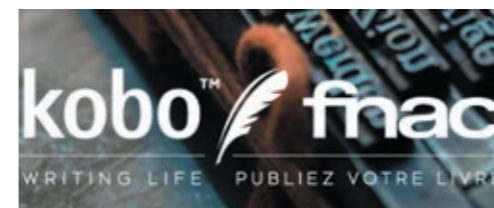
Le logo de « Writing Life » de Kobo et Fnac 11