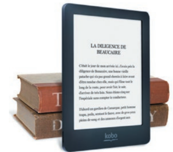
Vieux livres et liseuse avec Kobo by Fnac 13