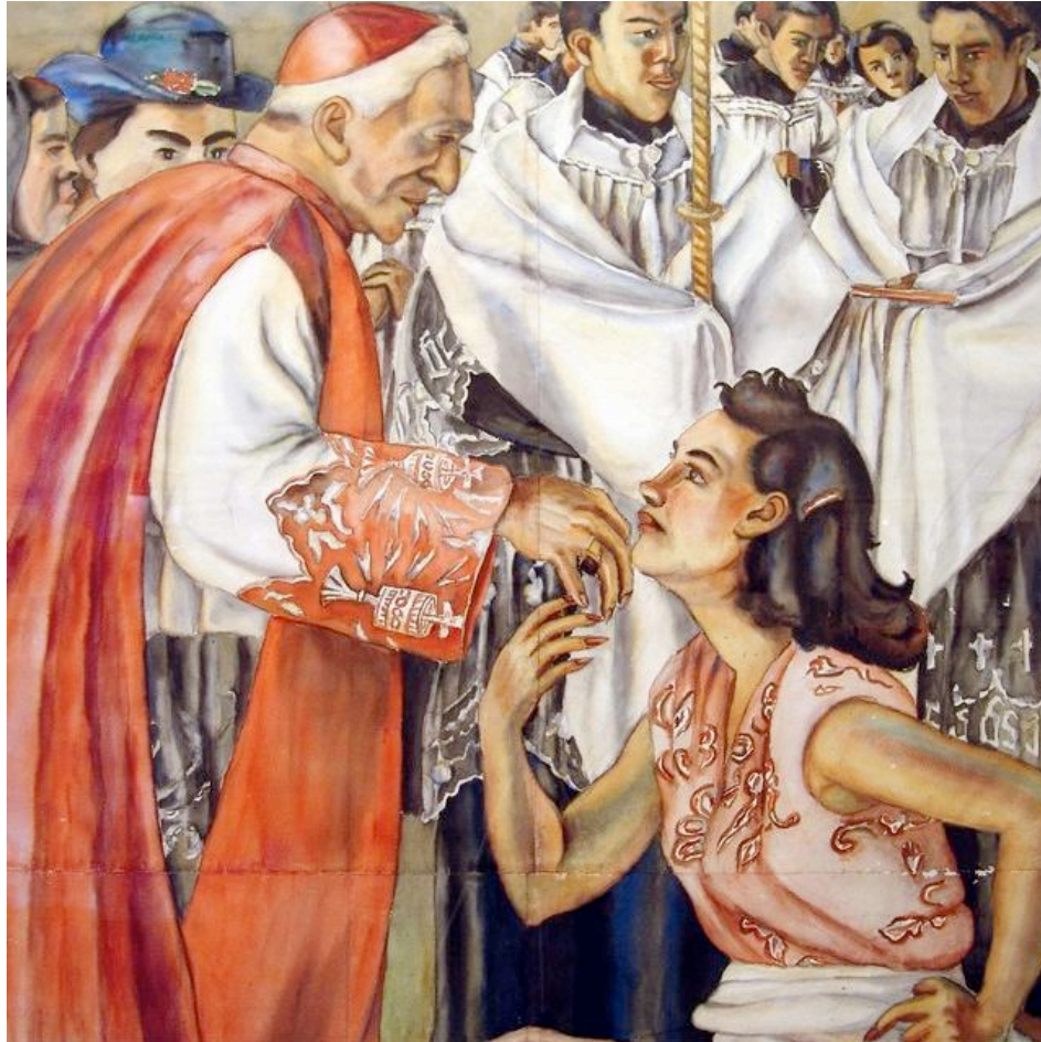
La procesión 9 , année 1942

jeunes curés et qui subit la réprobation des dames de la société. L'évêque semble également embarrassé. Et en effet, la reproduction de ce tableau dans la Revista municipal de Medellin en 1942 entraîna un litige entre les hauts prélats et les éditeurs. Les plaintes des autorités ecclésiastiques trouvèrent un écho au sein du Conseil Municipal, de sorte que la revue dut être retirée des kiosques.