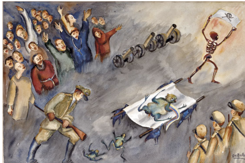
13 de junio, vers 1953

Quand enfin il abandonne le pouvoir, malade, Débora le peint en crapaud à la cravate tricolore. Sa civière est transportée par des vautours ; son cortège est mené par la camarade ; des hommes fanatiques, des curés, des militaires, des canons lui rendent les honneurs. Des petits crapauds-clones du malade sont chassés par le Général qui le succédera à la tête du pays dévasté.