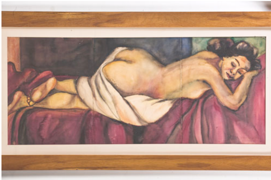
La amiga , vers 1939

du couvent. Dans ce minuscule espace de liberté, cette amie offrit à Débora Arango l'occasion de réaliser le tableau La amiga (L'amie):