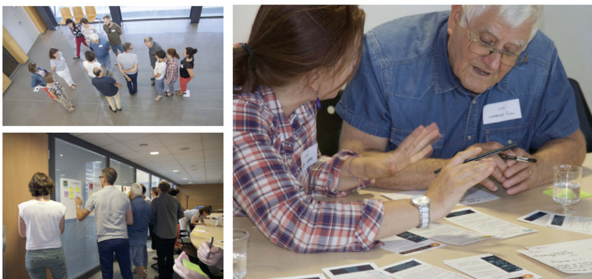
Figure 2. Atelier de co-conception avec des patients et professionnels de santé (juin 2017)