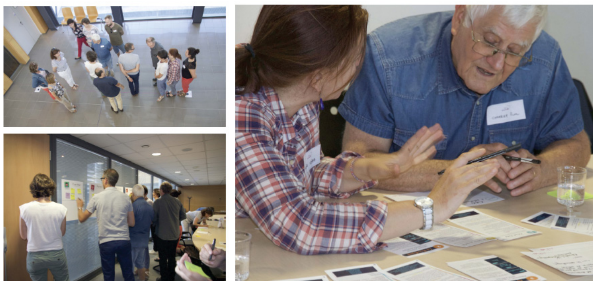
Figure 2. Atelier de co-conception avec des patients et professionnels de santé (juin 2017)