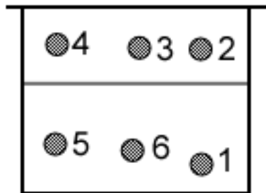
Figure 1. Les différents postes au volley-ball

Même si l'universalité des postes fait partie de l'essence du volley-ball, il est pertinent de spécialiser les joueurs à différents postes et notamment celui du passeur (Fig 1).