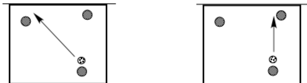
Figure 4. Attaque en 2eme main et du poste 1 au poste 4

Dans ce dispositif de 3 contre 3, la consigne pour le serveur est de ne pas trop mettre en difficulté la réception. L'équipe en réception a le choix de faire une réception du poste 1 vers le poste 4 ou de construire une attaque en 3 touches de balle. La première solution est une tactique de réception, combinée à une disponibilité de l'attaquant au poste 4 afin de surprendre les adversaires et rompre l'échange. Les joueurs doivent prendre la décision pendant l'action et ensuite justifier collectivement leur choix.