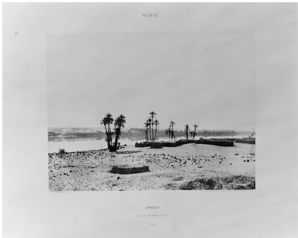
Dakkeh – village et rives du Nil – Pl. 125 / Félix Teynard phot./ Publié par Goupil et Cie éditeurs, Paris, Londres, Berlin, New York. (23,6 x 30,9 cm)

Sur cette photographie du village en ruines de Dakkeh , le premier plan rend compte d'une forte aridité, à travers l'ensablement des habitations et la présence de pierres éparses. Il contraste nettement avec le plan intermédiaire qui met en valeur le cours du Nil, les palmiers formant une transition naturelle entre eux. F. Teynard donne ainsi une vue globale d'un village abandonné, désolé, devant un fleuve symbole de fertilité et de vie . La neutralité du ciel, qui occupe plus de la moitié de la photographie, ajoute une impression de platitude à l'ensemble. Sa clarté uniforme forme un contraste impressionnant avec les parties sombres du cliché qui correspondent aux manifestations du vivant (constructions et matériaux, palmiers).