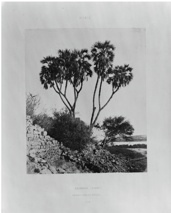
Kalabcheh (Talmis) – palmier doum et mimosa – Pl. 120 / Félix Teynard / Imp. Phot. de H. de Fonteny / Publié par Goupil et Cie éditeurs . (30,6 x 25,5 cm)

sensible , peut-être ethnographique et botanique . Au-delà des ruines antiques, il s'intéresse aux villages, à la végétation et aux paysages.