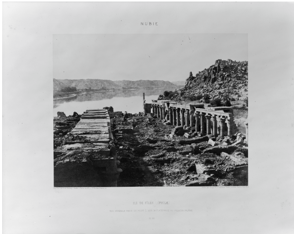
Ile de Fileh (Philae) – vue générale prise du point I, sur la plateforme du premier pylône – Pl.99/ Félix Teynard / Imp. Phot. de H. de Fonteny, fondée à Paris, en 1851, r. St Nicolas d'Antin, 72 / Publié par Goupil et Cie éditeurs, Paris, Londres, Berlin, New York. (24 x 30.5 cm)

Félix Teynard réalise des clichés de grande qualité lors de l' expédition qu'il mène en Egypte en 1851 et 1852 , peu après celle du photographe et écrivain Maxime Du Camp. Son but, affiché dans le titre même de son album, est de compléter , voire de corriger les planches de la Description de l'Égypte , ou Recueil des observations et des recherches qui ont été faites en Égypte pendant l'expédition de l'Armée française, publié par les ordres de Sa Majesté l'Empereur Napoléon le Grand (1809). Ce point est majeur car il vient appuyer les caractères documentaire et archéologique perceptibles dans la production photographique de Félix Teynard.