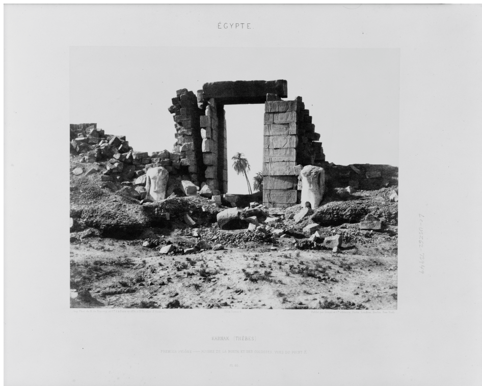
Karnak (Thèbes) – premier pylône – ruines de la porte et des colosses, vues du point E – Pl. 66 / Félix Teynard // Imp. Phot. de H. de Fonteny, fondée à Paris, en 1851, r. St Nicolas d'Antin, 72 / Publié par Goupil et Cie éditeurs, Paris, Londres, Berlin, New York. (24,5 x 30,5 cm)