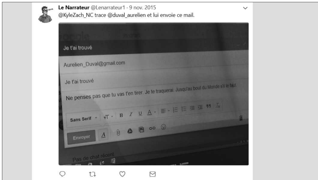
6. Capture de tweet : l'envoi d'un mail

Ce recours aux dimensions technologiques s'accompagnait même parfois d'une certaine créativité, comme lorsque les étudiants photographiaient un message écrit à partir d'une boîte de messagerie électronique :