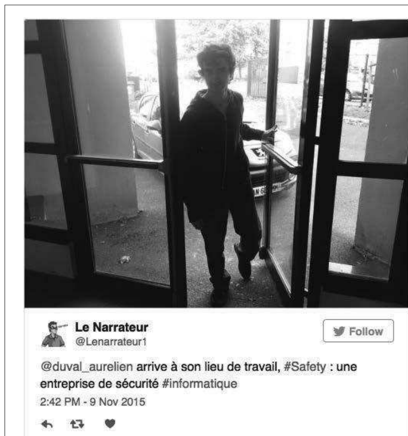
5. Capture de tweet : le recours au technolanguage