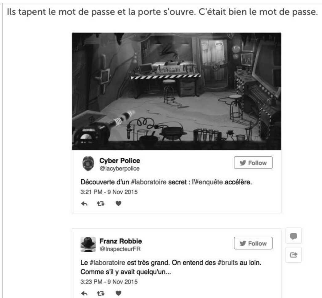
10. Capture d'écran : le Twittoryboard policier

D'autres pastiches jouaient davantage sur les codes d'un genre, mais moins pour les tourner en dérision que pour s'intégrer aux contraintes spécifiques. Par exemple pour le genre policier :