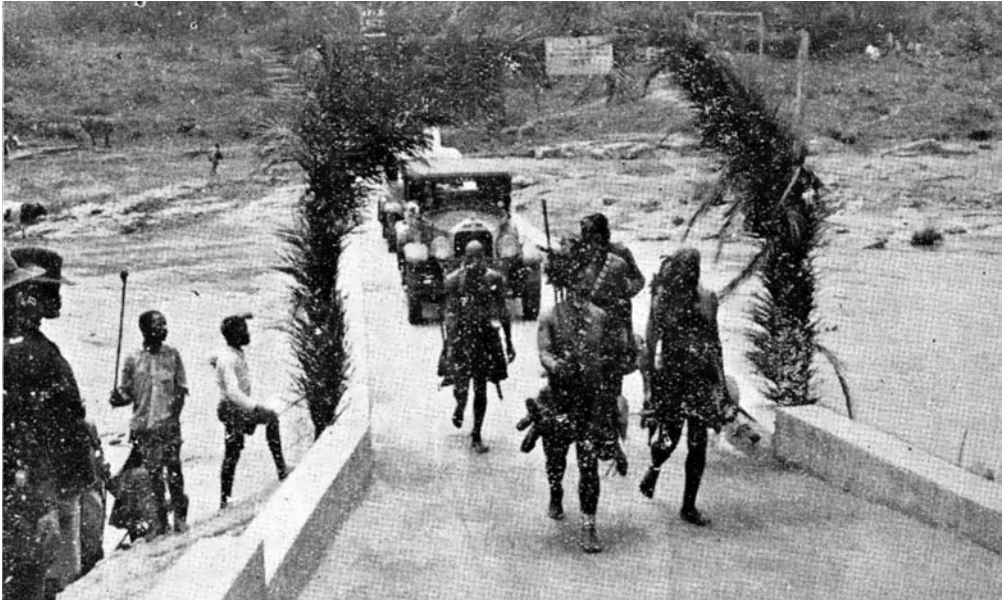
Illustration 3. Des guerriers, chantant le ihubo , précèdent les voitures après qu'elles ont fait demi-tour. Remarquez l'homme qui chante avec son bâton levé; au premier plan à gauche, à côté du policier, se tient un induna revêtu du costume militaire très apprécié parmi les Zoulous.