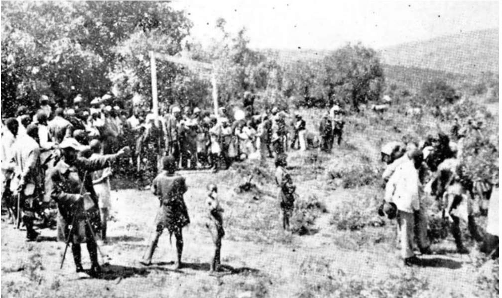
Illustration 4. Depuis la route en direction de l'est, la rive nord après l'inauguration. À gauche, autour des poteaux de but, le missionnaire (devant le poteau le plus proche) dirige le chant des hymnes. À l'extrémité de ce groupe, un certain nombre de païens. À droite, du bétail est découpé. Derrière le Zoulou en veste blanche, le vétérinaire en chef qui parle, et le Zoulou en tenue de guerre.]