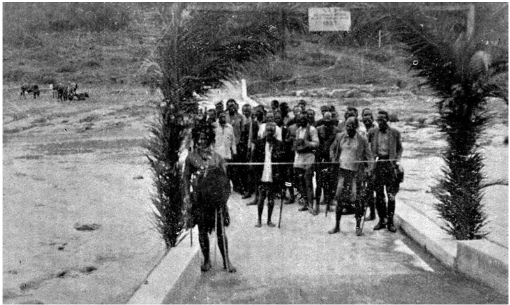
Illustration 1. Des Zoulous traversent le pont pour accueillir le commissaire en chef indigène et le régent. Remarquez l'homme en tenue de guerrier montant la garde; le panneau est en anglais.