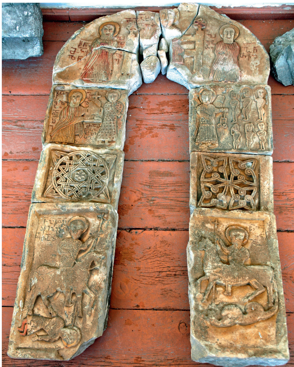
Église de Joisubani (région de Rač'a), Géorgie, IX e -X e siècle. Relief de la façade est : Le Jugement Dernier (représentant le Christ-Juge, les apôtres Pierre et Paul, les archanges Michel et Gabriel).