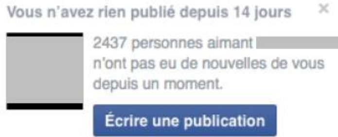
Fig. 4 – Capture d'écran d'un rappel sur une page Facebook.

Les injonctions contemporaines contradictoires de la « veille » et du « lâcher-prise » ou de la « présence » en ligne et de la « déconnexion » sont également appuyées sur ces objets singuliers et discrets, signes de l'influence et de la prégnance des temporalités des réseaux dans nos vies, et des motifs de l'économie de l'attention chez les acteurs qui en composent les écritures.