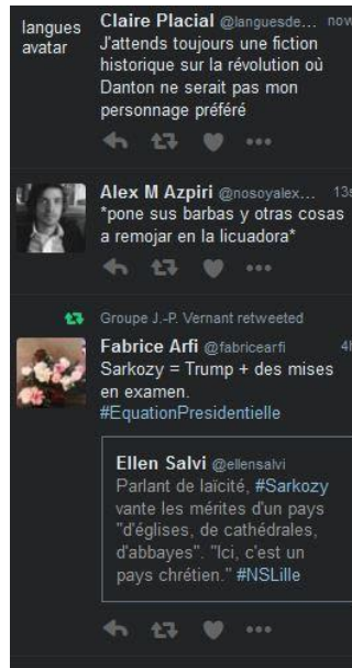
Fig. 3 - L'affichage des tweets par Tweetdeck .

Ainsi, les formats de présentation du temps des machines informatisées interviennent à la fois comme une nature technique dans l'organisation des objets et comme les éléments d'une dimension sociale du temps ; et les façons d'écrire impliquent des usages, des axiologies, une certaine esthésie et une relation éthique à ce temps construit.