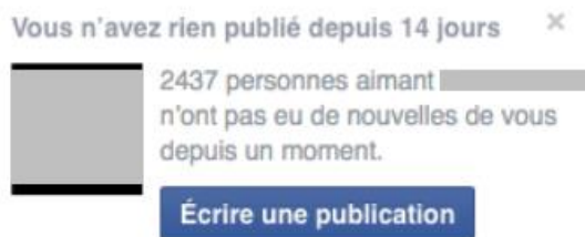
Fig. 4 – Capture d'écran d'un rappel sur une page Facebook.

Les injonctions contemporaines contradictoires de la « veille » et du « lâcher-prise » ou de la « présence » en ligne et de la « déconnexion » sont également appuyées sur ces objets singuliers et discrets, signes de l'influence et de la prégnance des temporalités des réseaux dans nos vies, et des motifs de l'économie de l'attention chez les acteurs qui en composent les écritures.