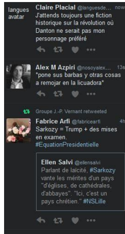
Fig. 3 - L'affichage des tweets par Tweetcheck .

Ainsi, les formats de présentation du temps des machines informatisées interviennent à la fois comme une nature technique dans l'organisation des objets et comme les éléments d'une dimension sociale du temps ; et les façons d'écrire impliquent des usages, des axiologies, une certaine esthésie et une relation éthique à ce temps construit.