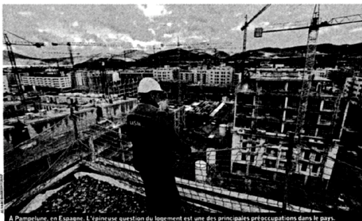
A Pamplona, en Espagne. L'épineuse question du logement est une des principales préoccupations dans le pays.

La Slovaquie est à l'image de l'Europe. Tous les pays affichent des compteurs au rouge : + 2 % en France, + 9,6 % en Estonie, qui n'est pas près de remplir les critères d'adhésion à l'euro. De son côté, l'eurostat a même annoncé pour la zone euro en décembre une inflation de 3,1 % sur un an, un chiffre inédit depuis six ans et demi. Partout, les facteurs explicatifs sont les mêmes : hausse des