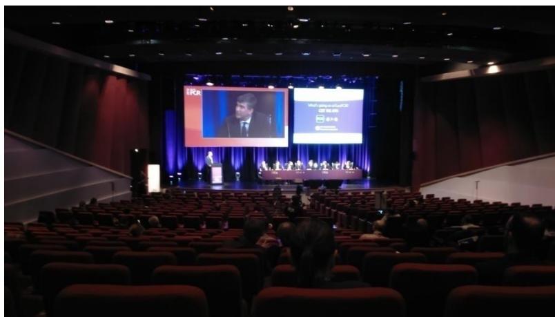
Une session « classique » dans le Théâtre Bordeaux : un dispositif théâtral traditionnel

Les sessions dites « classiques » constituent donc un modèle de base à partir duquel sont réinventés des types de sessions innovants.