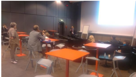
Une session dans le Sharing Center : une des intervenants est placée derrière le public, le mobilier est différent

Nous retrouvons ici, comme dans le théâtre performatif, un brouillage de l'identité des « rôles », une réduction de la « frontalité » et de la séparation entre la scène et la salle, une modification des marqueurs de l'espace de la parole, de l'action et du « jeu ». La scène matérialisée par une estrade tend à disparaître, le corps de l'intervenant prenant place parmi les corps des participants plutôt que derrière un pupitre, l'éclairage baignant l'ensemble plutôt que créant une focalisation sur la scène.