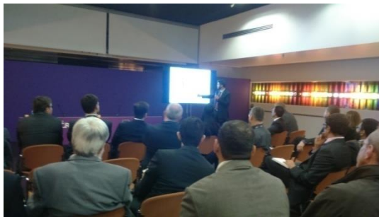
Une session en Room Arlequin : si le « décor » classique est installé, il n'est pas utilisé (la table et le pupitre sont inoccupés, au profit d'une mobilité des intervenants dans la salle)

Ici, l'espace n'est plus celui d'une théâtralité classique renvoyant au « drame », frontale, mais d'un véritable dispositif. Selon Arnaud Rykner :