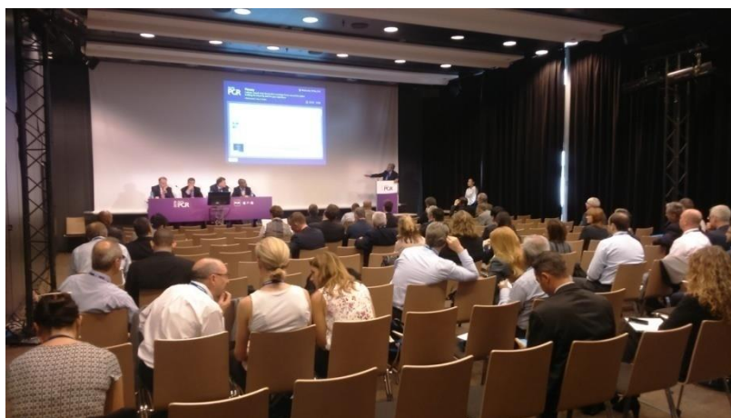
Une session « classique » en Room 342 : un dispositif reproduit à l'identique

Le décor y est toujours globalement le même : un écran central sur lequel les présentations visuelles sont projetées, un pupitre situé « à cour » ou « à jardin » d'où s'exprime chaque intervenant, et une longue table, à droite ou à gauche, où s'installent les modérateurs de la session. L'écran, le pupitre et la table sont autant de matérialisations physiques d'un espace de scène clairement délimité. Selon les possibilités techniques, l'espace de scène peut également faire l'objet d'une mise en lumière et d'une sonorisation spécifiques (l'intervenant comme les modérateurs sont équipés de micros). Face à cette scène, nous trouvons l'espace de la salle, souvent situé un peu plus bas que la scène et organisé en plusieurs rangées de sièges, installées sur un seul niveau (petites salles) ou bien sous la forme de gradins (dans les « théâtres » notamment, mais aussi dans la Main Arena ).