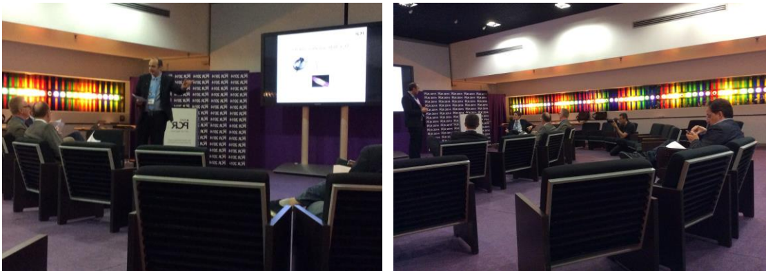
Sharing Centre EuroPCR 2014

En outre, telles que décrites dans le programme, ces sessions se fondent également sur un rapport au temps différent des sessions classiques puisqu'elles laissent aux congressistes la responsabilité de mettre un terme à la session, en fonction de leurs propres attentes et besoins. De plus, ces espaces invitent à la prise de parole de participants invités à devenir plus actifs, acteurs d'une représentation dans laquelle ils ont clairement un rôle à jouer. Ainsi le scénario de la session, s'il a pu être soigneusement préparé, est-il plus libre et moins calibré d'avance, comme en témoigne le programme du congrès : les interventions ne sont pas minutées, et l'intervenant peut par exemple partir des besoins exprimés par les participants. Le « rôle » de l'intervenant, déplacé, implique une faculté d'improvisation que le modèle spatial et temporel de la session classique implique moins.