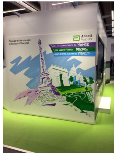
Le stand de l'industrie comme espace de création