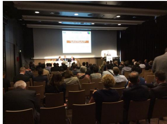
Sessions « classiques » EuroPCR 2014

Dans le congrès EuroPCR, les espaces des sessions correspondent – nous l'avons vu – à des scénographies traditionnelles, fondées sur l'observation, où la division scène/salle, le rapport de frontalité et la « passivité » des participants renvoie à l'origine du théâtre (« theaomai » signifie « regarder, contempler » et « teatron », lieu d'où l'on regarde) et divise de fait l'espace du public et de la scène. Dans cet espace, l'accent est mis sur l'image (projetée) et sur le texte (la voix amplifiée) plus que sur le corps, souvent dissimulé derrière les éléments scéniques, et dont les mouvements sont rares. Si ce type de session fait modèle, des variations peuvent être notées en fonction du type de « dramaturgie » utilisé (plusieurs interventions successives autour d'un thème, un « live » diffusé et commenté dans sa chronologie, une série, etc.), et en fonction de la manière dont les intervenants s'en saisissent : la performance de « l'acteur » à partir de ce modèle peut contribuer à déplacer les usages d'une scénographie reproduite à l'identique.