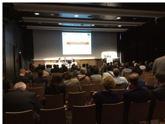
Sessions « classiques » EuroPCR 2014

Dans le congrès EuroPCR, les espaces des sessions correspondent – nous l'avons vu – à des scénographies traditionnelles, fondées sur l'observation, où la division scène/salle, le rapport de frontalité et la « passivité » des participants renvoie à l'origine du théâtre (« theaomai » signifie « regarder, contempler » et « teatron », lieu d'où l'on regarde) et divise de fait l'espace du public et de la scène. Dans cet espace, l'accent est mis sur l'image (projetée) et sur le texte (la voix amplifiée) plus que sur le corps, souvent dissimulé derrière les éléments scéniques, et dont les mouvements sont rares. Si ce type de session fait modèle, des variations peuvent être notées en fonction du type de « dramaturgie » utilisé (plusieurs interventions successives autour d'un thème, un « live » diffusé et commenté dans sa chronologie, une série, etc.), et en fonction de la manière dont les intervenants s'en saisissent : la performance de « l'acteur » à partir de ce modèle peut contribuer à déplacer les usages d'une scénographie reproduite à l'identique.