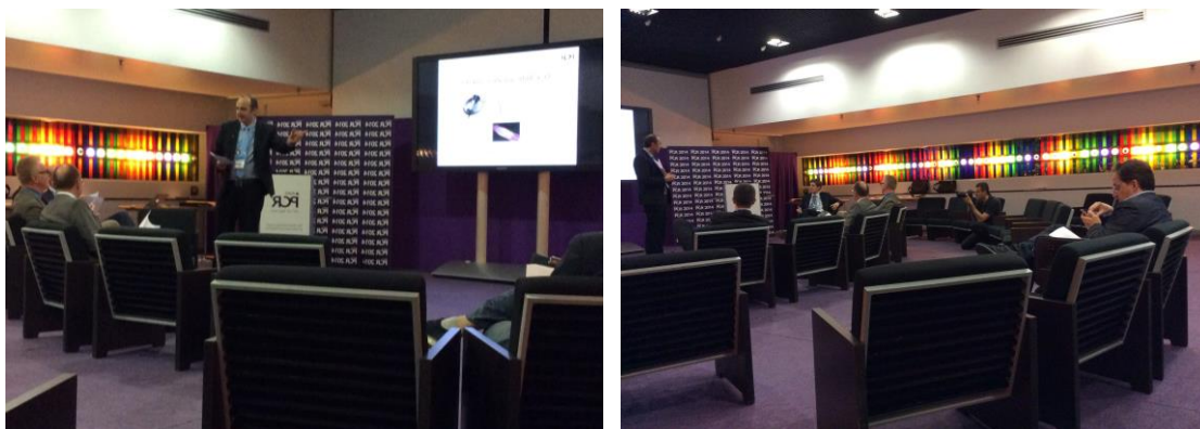
Sharing Centre EuroPCR 2014

En outre, telles que décrites dans le programme, ces sessions se fondent également sur un rapport au temps différent des sessions classiques puisqu'elles laissent aux congressistes la responsabilité de mettre un terme à la session, en fonction de leurs propres attentes et besoins. De plus, ces espaces invitent à la prise de parole de participants invités à devenir plus actifs, acteurs d'une représentation dans laquelle ils ont clairement un rôle à jouer. Ainsi le scénario de la session, s'il a pu être soigneusement préparé, est-il plus libre et moins calibré d'avance, comme en témoigne le programme du congrès : les interventions ne sont pas minutées, et l'intervenant peut par exemple partir des besoins exprimés par les participants. Le « rôle » de l'intervenant, déplacé, implique une faculté d'improvisation que le modèle spatial et temporel de la session classique implique moins.