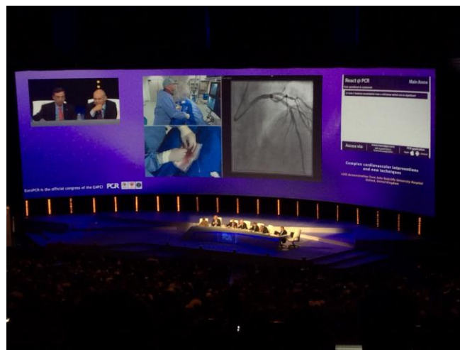
LIVE : Intervention en direct du John Radcliffe Hospital, Oxford, Royaume-Uni, retransmise en Main Arena EuroPCR 2016

Ainsi, au sein d'Europa, les LIVE (projection d'opérations en cours pendant le congrès) sont une prouesse technologique et permettent d'inviter au sein de l'espace congrès un espace médical (le cath lab 20 ) localisé à l'autre bout de la planète. L'espace autre s'invite dans le congrès mais les congressistes eux-mêmes sont invités à voyager hors du congrès en assistant eux-mêmes à une intervention qui a lieu ailleurs. Si l'on pousse la réflexion (et peut-être si l'on extrapole), on peut s'interroger sur la tension entre un espace étranger au congrès VS espace familier pour le public (le cath lab ). 21