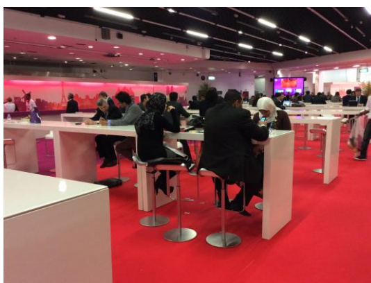
Lunch area EuroPCR 2014

Si les industries semblent donc avoir pris en compte la dimension scénographique et expérientielle dans l'installation des stands sur l'espace d'exposition, cela reste encore de l'ordre de l'impensé pour certains espaces considérés comme informels ou non formels (ou non repérés), à côté des espaces des sessions : citons les espaces destinés aux repas par exemple.