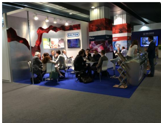
L'industrie prend en compte la fonction de socialisation et prévoit, pour cela, des espaces destinés à créer des sous-espaces de communication interpersonnelle

C'est ainsi que le congrès dans sa complexité 17 (avec un point de vue macro/méso ou micro) est susceptible d'être pensé dans l'alternance possible de scénographies différenciées. Qu'elles soient observantes ou participantes, fondées sur la mobilité ou la participation, elles peuvent intégrer des sons, de la lumière, des flux, des parcours, des jeux de mise en scène et de mise en espace différents selon l'échelle spatiale envisagée, selon le moment envisagé ou selon les parcours choisis des participants (individuation peut-être à travailler). L'espace-temps entier peut-être scénographié avec ses caractéristiques spécifiques et ses supports non seulement en lui-même mais aussi en interaction avec le reste des activités programmées. Pour l'instant il nous semble que ce sont les activités liées à l'industrie qui font l'objet d'une scénographie plus systématique, notamment lors de la visite de l'espace d'exposition, qui occupe une place centrale au sein du Palais des congrès où se déroule l'événement. Cet espace, relevant principalement de la fonction de promotion dont nous parlions plus haut, se distribue en une multitude de stands que chacune des industries présentes choisit de mettre en espace et parfois, de mettre en scène. Ainsi, la stratégie marketing de ces industries a intégré, pour l'organisation des stands, les potentialités scénographiques dont d'autres activités ne sont pas encore assez emparés.