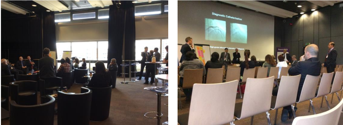
Session en trois temps EuroPCR 2015

communication interpersonnelle », autour d'objets intermédiaires (feuille de papier, tasse de café, smartphone, etc.). Ainsi, un premier espace a été pensé et mis en place de manière à faciliter la prise de parole par la « salle ». Cet espace prévoyait la répartition des participants par petits groupes, autour d'une tasse de café, afin de créer une atmosphère conviviale, propice à la prise de parole. Le temps 2 de la session était, quant à lui, un temps de présentation par des intervenants, lors duquel la prise de parole par le public n'était pas prioritaire. Ainsi, nous nous retrouvions dans un espace-temps plus formel et l'organisation de l'espace reprenait les codes des sessions dites « classiques », c'est-à-dire caractérisées par une forte frontalité scène/salle.