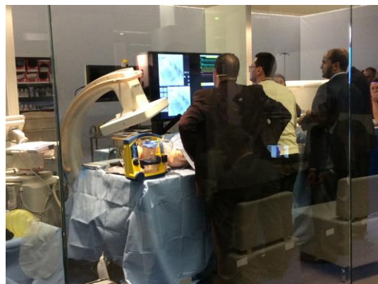
Mettre en espace, mettre en scène pour promouvoir

Si les industries semblent donc avoir pris en compte la dimension scénographique et expérientielle dans l'installation des stands sur l'espace d'exposition, cela reste encore de l'ordre de l'impensé pour certains espaces considérés comme informels ou non formels (ou non repérés), à côté des espaces des sessions : citons les espaces destinés aux repas par exemple.