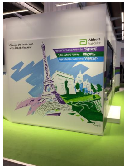
Le stand de l'industrie comme espace de création