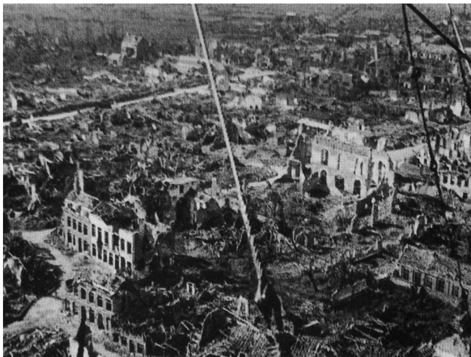
Figura 4. En dirigeable sur les champs de bataille, 1919