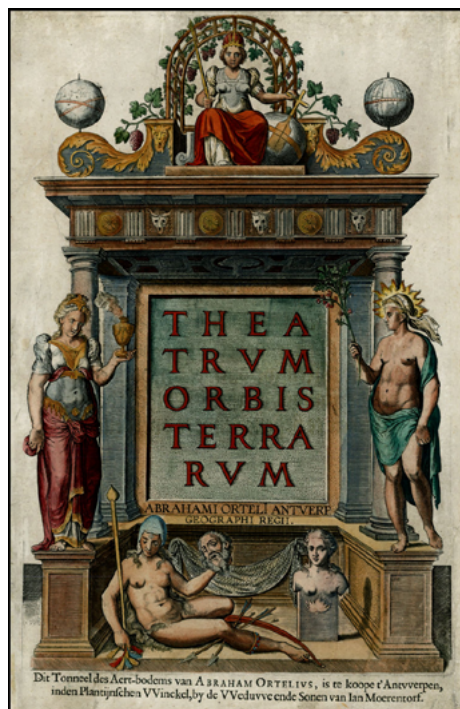
Figura 1. Frontispício do atlas Theatrum Orbis Terrarum, editado em Antuérpia em 1570, Paris, BnF.