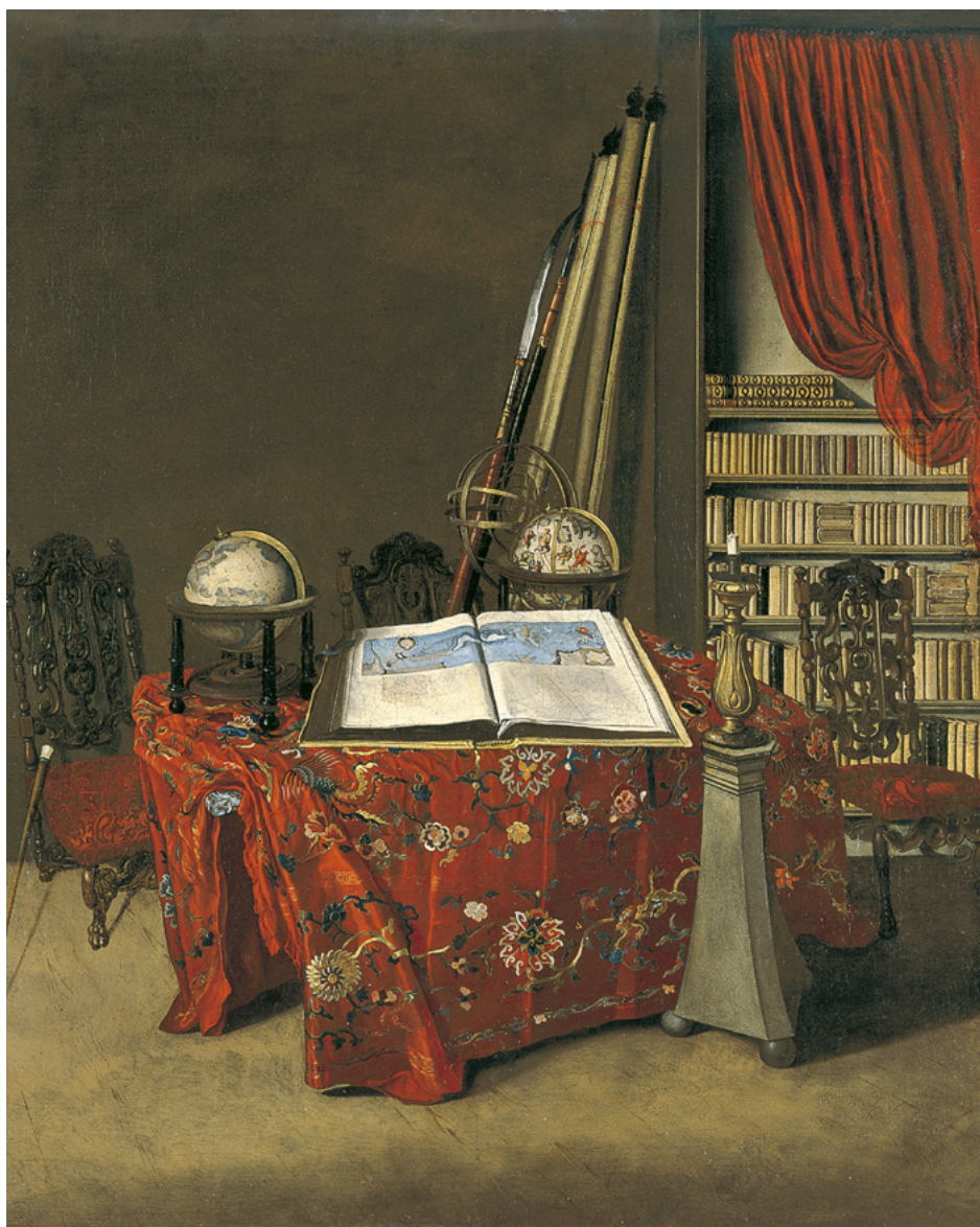
Figura 3. Vista de uma biblioteca (detalhe), Jan van der Heyden, vers 1710-1712, huile sur toile, 77 x 63.5 cm, Madrid, Museo Thyssen-Bornemisza.

Referindo-se às bolsas Autour du Monde (estabelecidas por Kahn em 1898), Henri Bergson escreveu a propósito da vontade do seu amigo Kahn de abrir “o grande livro do mundo” a uma elite de jovens licenciados (Bergson, 1931). Na realidade, a expressão pertence ao filósofo René Descartes, um homem que, recorde-se, se instalou na Holanda em 1628 e que era certamente familiar da produção cartográfica do seu tempo. O que é o “grande livro do mundo” senão um atlas, a enciclopédia visual do mundo (Figura 3)?