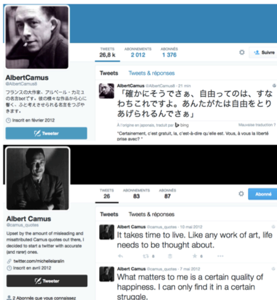
Camus et ses nombreux doubles