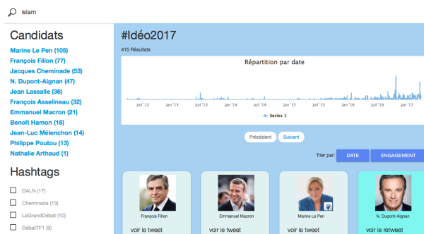
FIG. 2 – Moteur de recherche à facettes - recherche du mot islam.