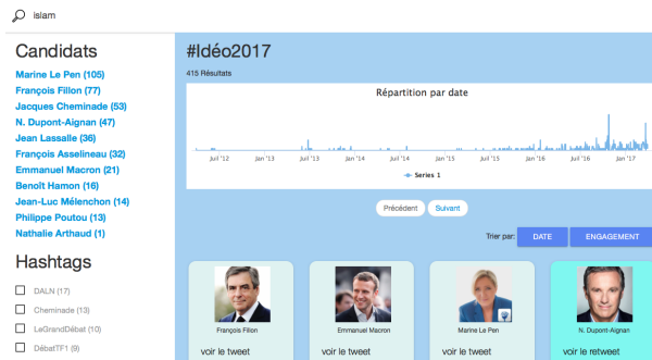
FIG. 2 – Moteur de recherche à facettes - recherche du mot islam.