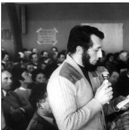
C'est en exprimant son avis que le paysan participe à la vie démocratique de son organisation professionnelle.

Quelques crises majeures vont transformer ce « paysage ». À la fin du XIX e siècle, le phylloxéra détruit le vignoble du Sud de la France. Les ceps replantés se montrent généreux, mais entre-temps les fraudes s'étaient multipliées et les vins d'origine algé-