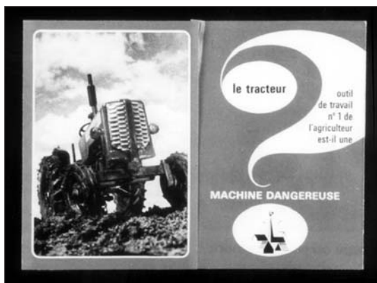
Les mutuelles informent les paysans sur les risques de la motorisation pour les inciter à s'assurer.

Après de nouvelles turbulences à la suite de la Seconde Guerre mondiale, l'organisation du secteur libre ne commence véritablement à se bâtir qu'en 1958, avec la