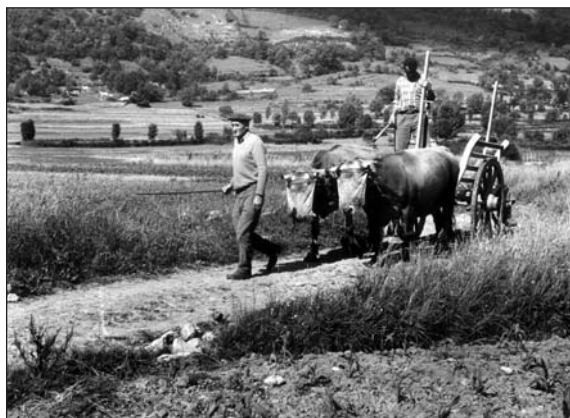
Avant l'arrivée du tracteur, la traction animale assurait les gros travaux de la ferme.

L'Histoire nous apprend qu'il n'y a de progrès humain que dans l'organisation et l'action collective. Et la société est une construction permanente, toujours à inventer. Ce document entend modestement contribuer à cette recherche, par-delà les frontières et les doctrines.