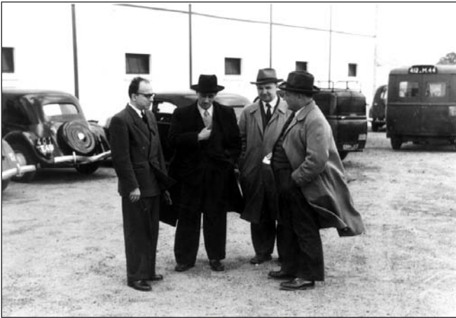
Les campagnes françaises ont longtemps été dominées par des notables qui décidaient pour les paysans.

Au début de ce siècle, sur la terre de France, l'avenir appartenait à ceux qui voulaient travailler. Il fallait nourrir le pays. Fils de paysans et futurs paysans, les jeunes n'avaient guère d'autre choix. Mais cela signifiait des conditions de vie difficiles par rapport à « ceux de la ville ». Les quelques jeunes qui s'en étaient allés travailler là-bas étaient mieux habillés que nous, parlaient mieux, savaient mieux se présenter. Ils étaient