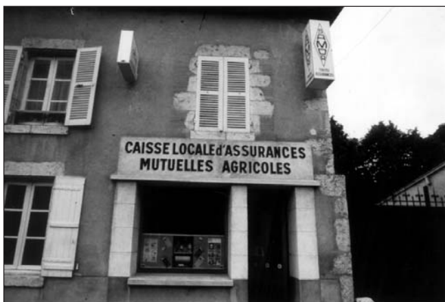
Les premières Caisses locales utilisaient de modestes locaux.

Grâce à sa proximité géographique (jusqu'à 11 000 agences) et psychologique (les Caisses régionales recrutent des gens de la région), jointe à son esprit de service et au