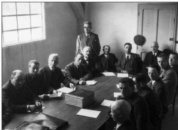
Le conseil d'administration de la Caisse locale de Neug-sur-Beuvron. qui prend les décisions

tivité agricole dissuade les banquiers par sa faible rentabilité et ne trouve pas, chez eux, un système de crédit adapté à ses spécificités. Alors qu'en agriculture un prêt à court terme doit durer au moins de la mise en terre des produits (semences, tubercules) jusqu'au paiement de la récolte, la banque clas-