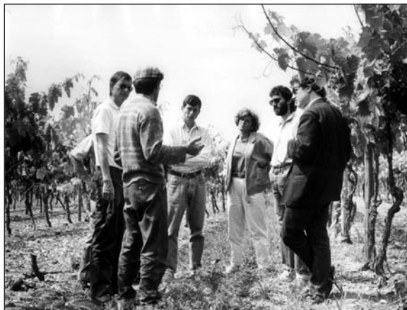
Le Ceta est une coopérative d'idées où tout peut se