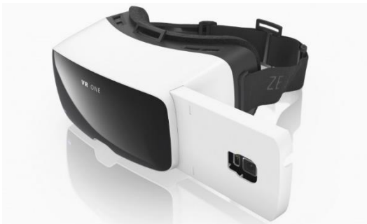
Figure 3. Casque VR ONE© mobile de réalité virtuelle

Ici aussi, l'approche expérimentale nous semblait être l'option méthodologique la plus appropriée pour répondre à l'objectif visé. L'étude a mobilisé 21 participants (2 femmes et 19 hommes). L'application utilisée, « King Tut VR2 », offre la possibilité aux participants de revivre la découverte du tombeau du pharaon Toutankhamon par Howard Carter.