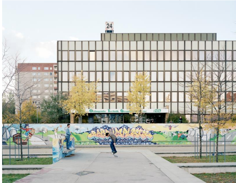
Figure 2. : Fresque réalisée dans le cadre du programme « ville sociale » dans le quartier nord de Marzahn, 2003.