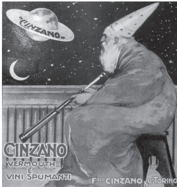
Publicité Cinzano Pise, collection Paicap