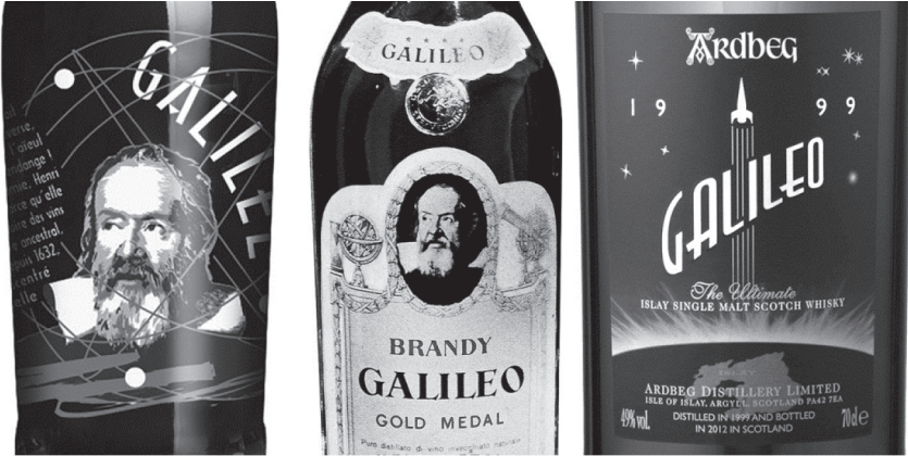
Arbois Henri Maire «cuvée Galilée»