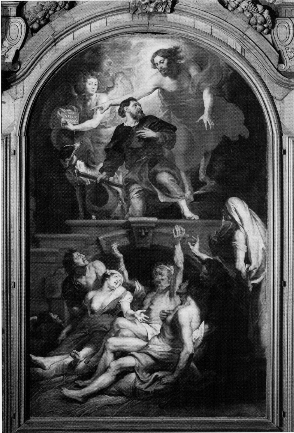
Fig. 7. P. P. Rubens, Saint Roch protecteur des lépreux , 1623, huile sur toile, 112 x 258 cm, Alost, église de Sint Martinus.