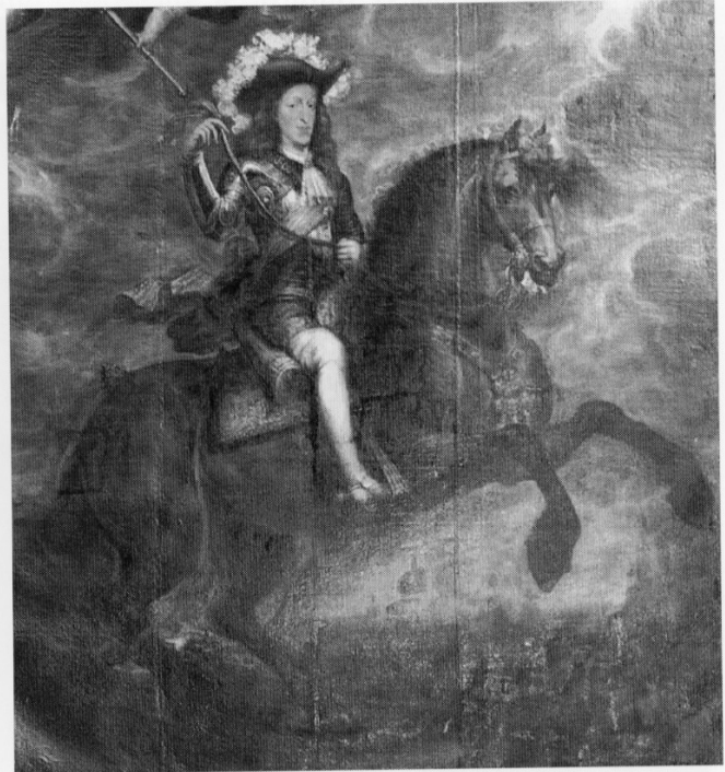
Fig. 10. Francisco Rizi, Portrait de Charles II à cheval (détail), 1679, huile sur toile, Tolède, Hôtel de Ville.

constatons aussi cette influence. Celle de Van Dyck est particulièrement frappante dans le Portrait d'un général d'artillerie au Prado (fig. 9). La grâce de la posture, le sens morbide du coloris, et ses dégradés bleus, gris et bruns rappellent tout à fait la manière du maître anversois.