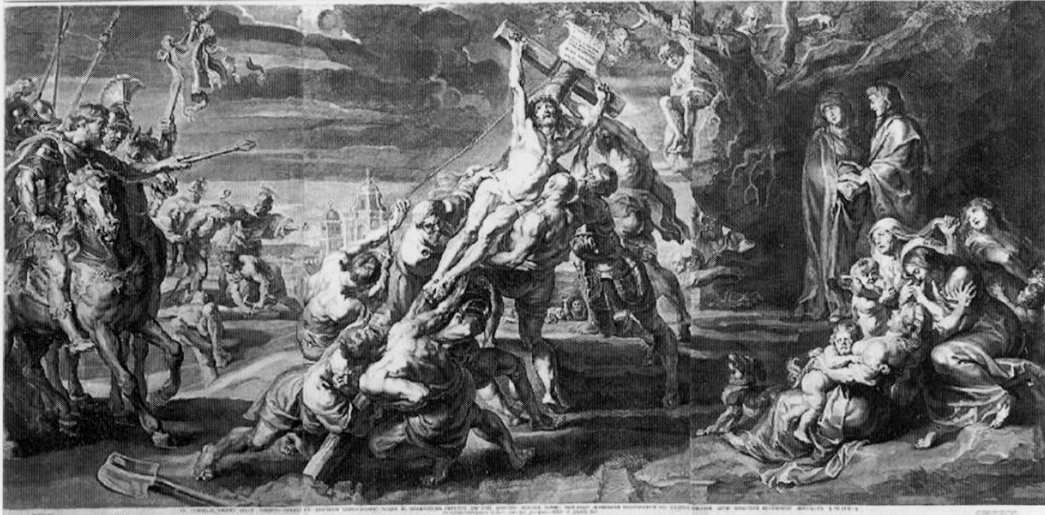
Fig. 2. Hans Witdoeck d'après Peter Paul Rubens, L'Érection de la Croix , 1638, gravure. © British Museum

Fernando (37) , nous montrent que la gravure était connue à Madrid. Pour sa part, Rizi y a puisé de nombreux détails, spécialement les figures de bourreaux à l'arrière-plan. Parmi eux, se détache celui qui tend une corde pour hisser la croix. Les postures et les attitudes, tendues et très dynamiques, sont très proches de celles de la gravure. Au premier plan, à droite, la figure de la Madeleine rappelle celles du groupe de femmes situé au même endroit dans la gravure.