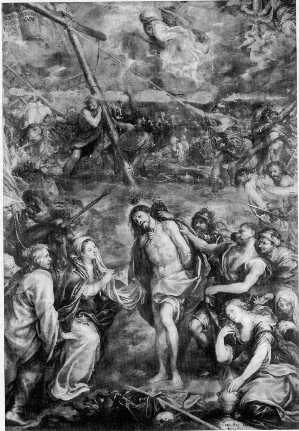
Fig. 1. Francisco Rizi, Le Christ bafoué (détail), 1651, huile sur toile, 527 x 352 cm, Madrid, Museo Nacional del Prado.