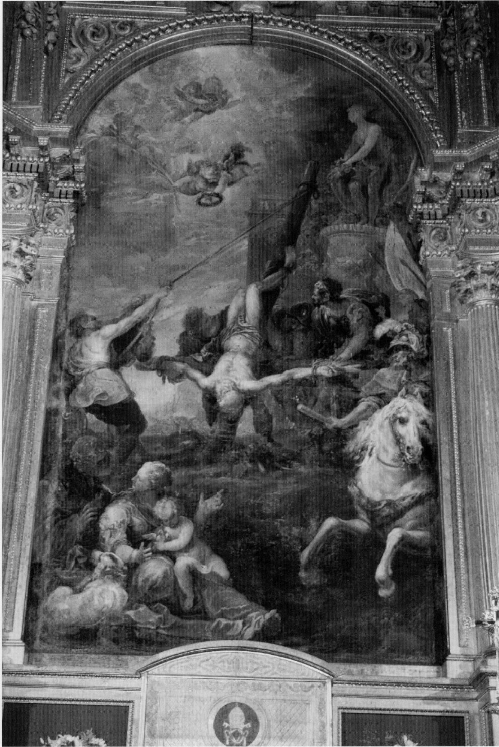
Fig. 3. Francisco Rizi, Martyre de saint Pierre , 1655, huile sur toile, Fuente del Saz, église de San Pedro.