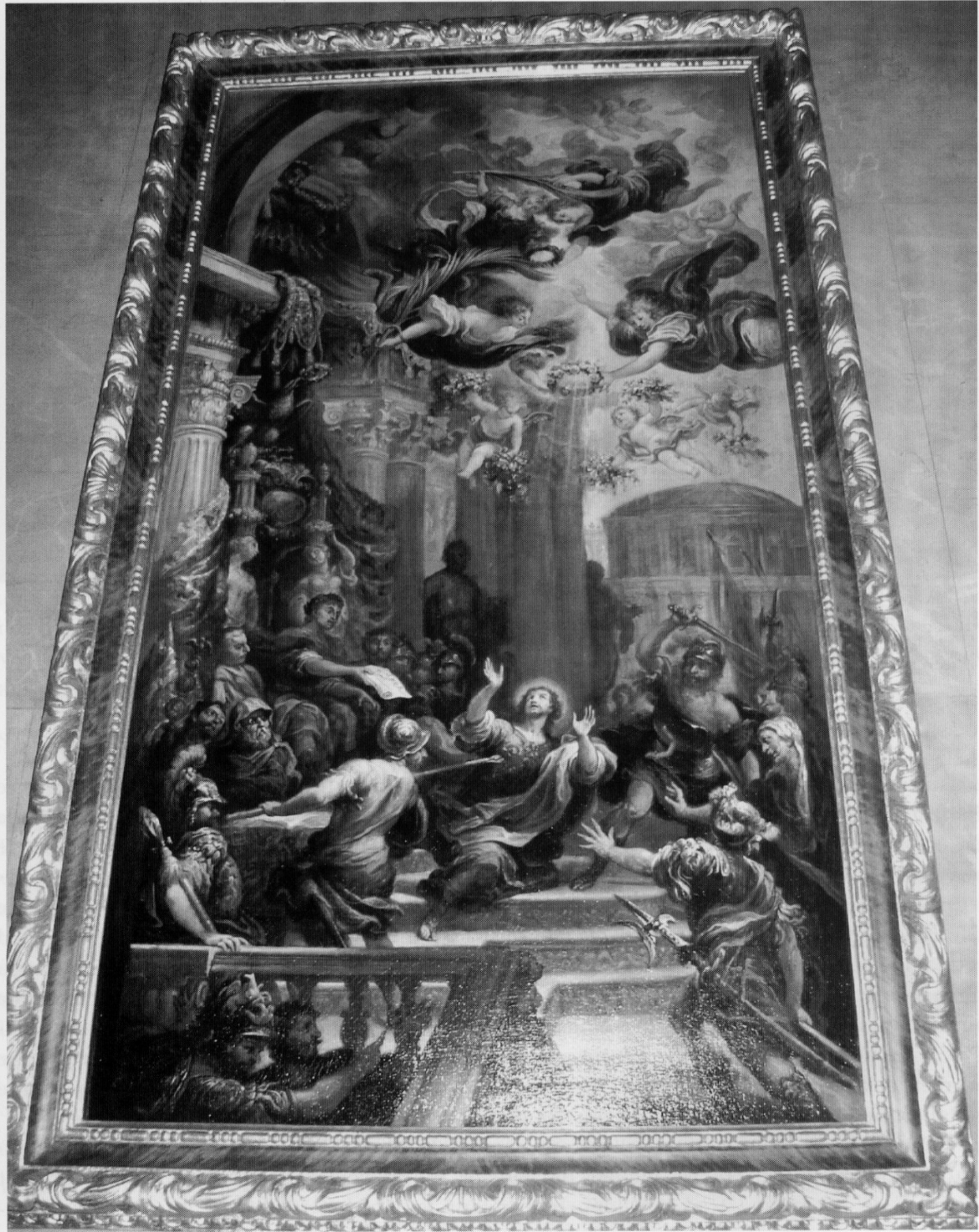
Fig. 8. Francisco Rizi, Le Martyre de saint Gènes d'Arles , 1671, huile sur toile, 165 x 85 cm, Madrid, église de San Ginés.