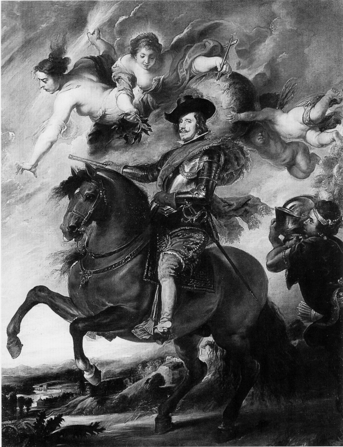
Fig. 5. P. P. Rubens, Portrait de Philippe IV , copie, huile sur toile, Florence, Museo degli Uffizi.