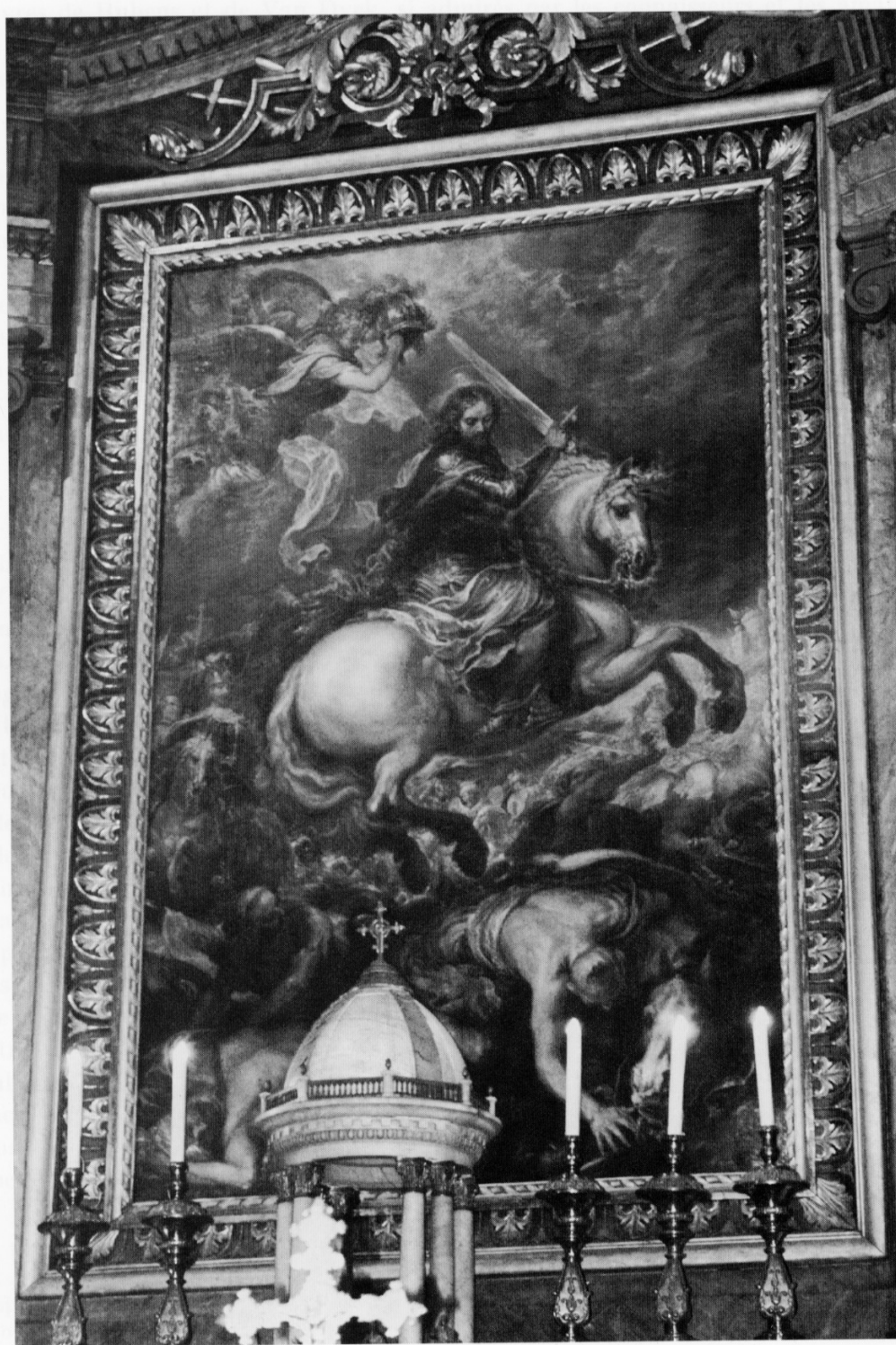
Fig. 4. Francisco Rizi, Saint Jacques Matamores à la bataille de Clavijo, c. 1648-1652, huile sur toile, Madrid, église de Santiago.