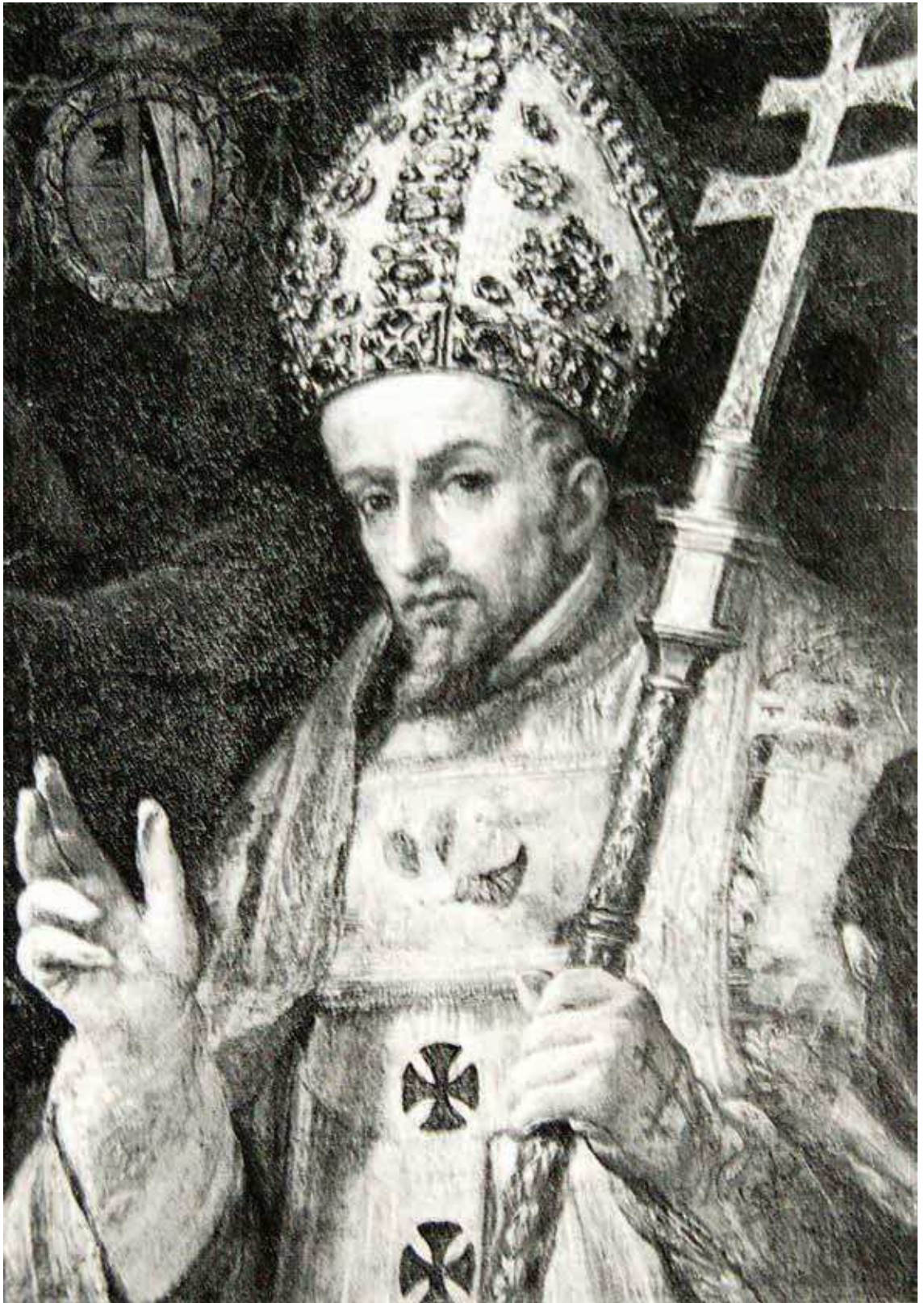
Fig. 3. Francisco Rizzi, Retrato del cardenal Baltasar Moscoso y Sandoval , óleo sobre lienzo, 80 x 56 cm, 1666. Toledo, Diputación Provincial