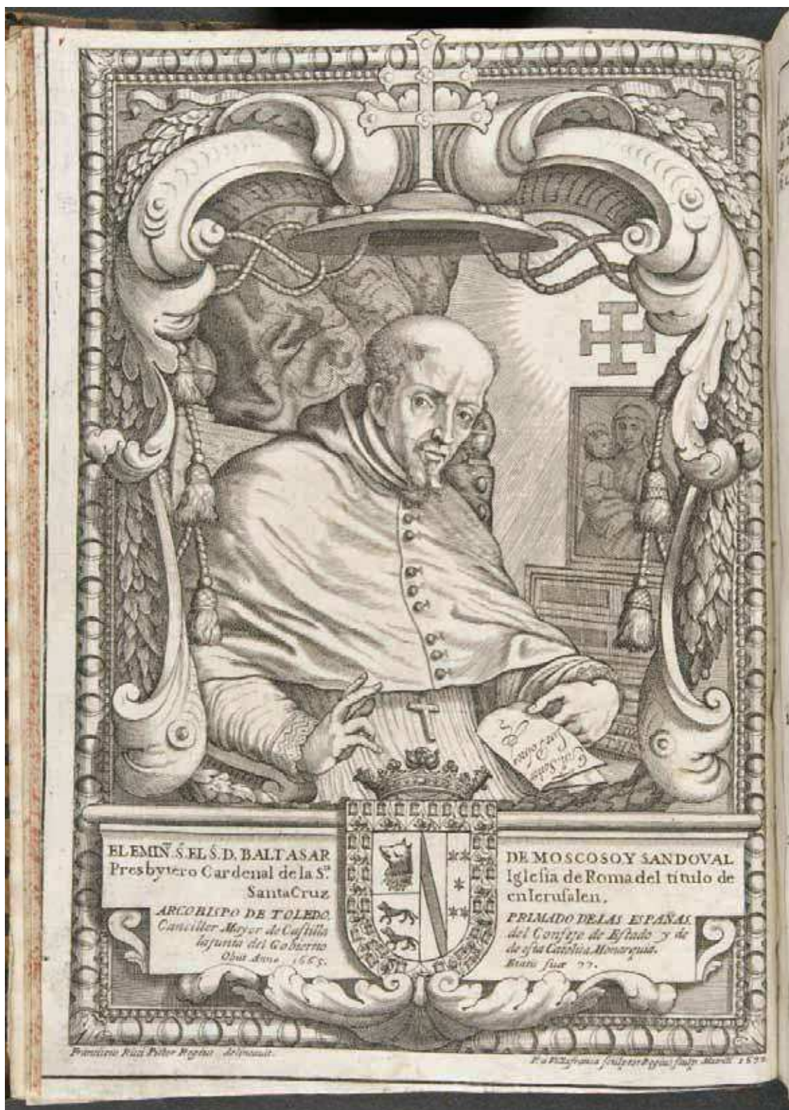
Fig. 4. Pedro de Villafranca según Francisco Rizi, Retrato del cardenal Baltasar Moscoso y Sandoval , grabado calcográfico, 1670