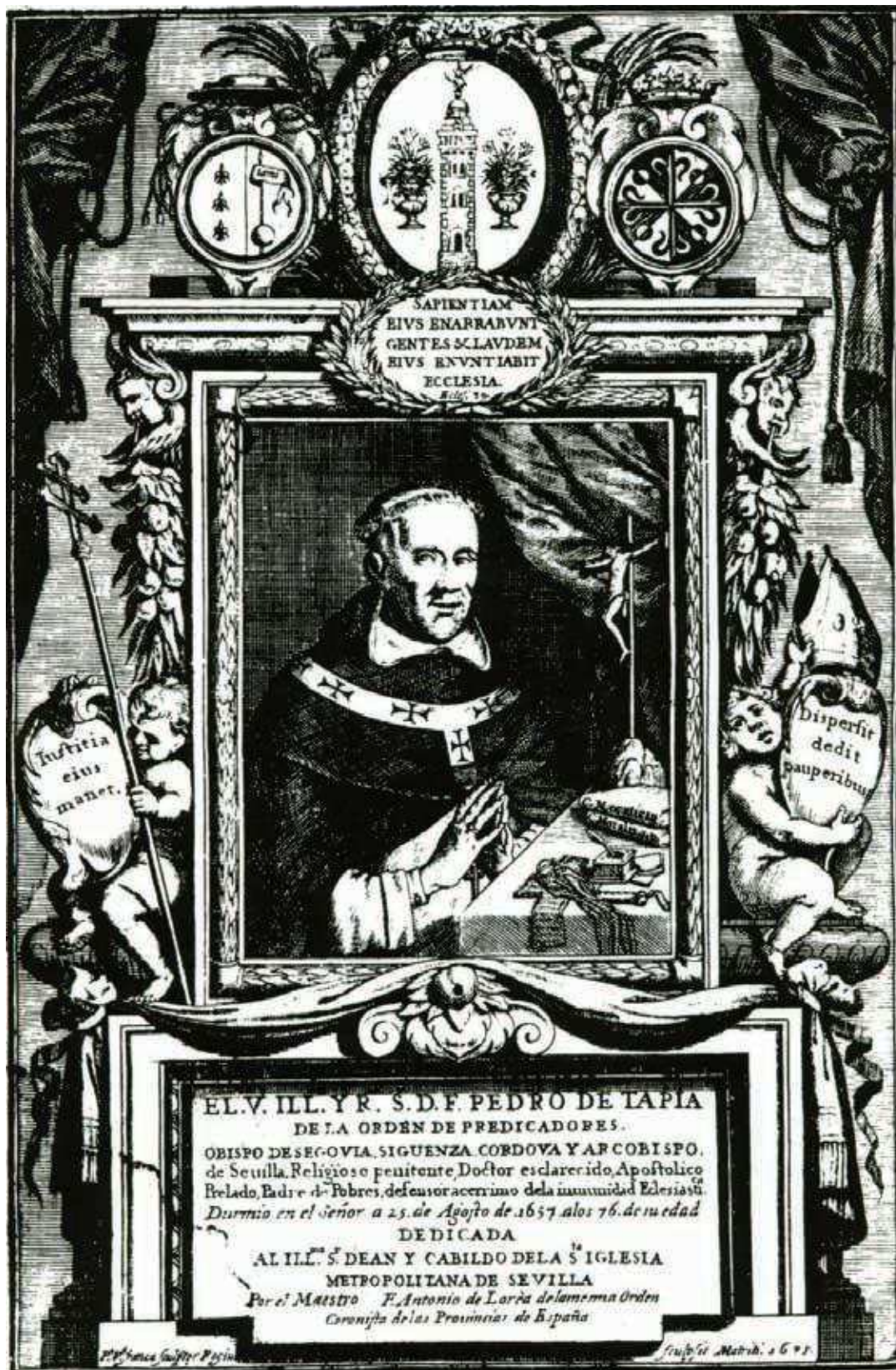
Fig. 2. Pedro de Villafranca, Retrato de Fray Pedro de Tapia, grabado calcográfico, 1675