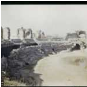
[Nice?], Alpes-Maritimes, France (?), Sans date, (Autochrome, 9 x 12 cm), opérateur non mentionné, Département des Hauts-de-Seine, musée Albert-Kahn, Archives de la Planète, A 72 165