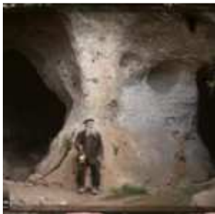
Les Eyzies, La double entrée du Font de la Gaume, Dordogne, France, 6 mai 1916, (Autochrome, ), Auguste Léon, Département des Hauts-de-Seine, musée Albert-Kahn, Archives de la Planète, A 8 469