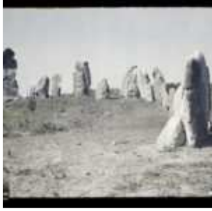
L'un des cromlechs d'Er Lannic, Er-Lanic, Morbihan, Bretagne, France, 21 avril 1924, (Autochrome, 9 x 12 cm), Georges Chevalier, Département des Hauts-de-Seine, musée Albert-Kahn, Archives de la Planète, A 41 083