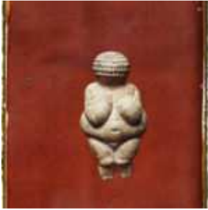
Saint-Germain-en-Laye, France, 6 juin 1921, (Autochrome, ), Auguste Léon, Département des Hauts-de-Seine, musée Albert-Kahn, Archives de la Planète, A 27 515