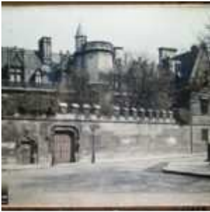
Le musée de Cluny rue du Sommerard, Paris (Ve arr.), France, 26 mars 1923, (Autochrome, 9 x 12 cm), Auguste Léon, Département des Hauts-de-Seine, musée Albert-Kahn, Archives de la Planète, A 37 694