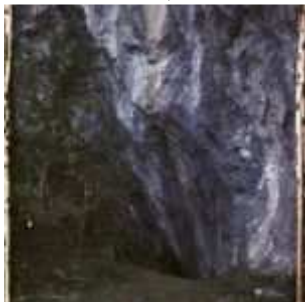
L'entrée de la Grotte de Niaux, Niaux, Ariège, Midi-Pyrénées, France, 7 octobre 1921, (Autochrome, 12 x 9 cm), Georges Chevalier, Département des Hauts-de-Seine, musée Albert-Kahn, Archives de la Planète, A 29 076 S