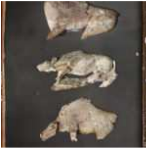
Saint-Germain-en-Laye, France, 6 juin 1921, (Autochrome, ), Auguste Léon, Département des Hauts-de-Seine, musée Albert-Kahn, Archives de la Planète, A 27 508