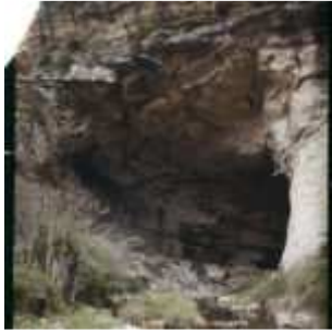
Le Mas-d'Azil avec les éboulis de la rive gauche, Mas-d'Azil [Le], Ariège, Midi-Pyrénées, France, 14 avril 1921, (Autochrome, 12 x 9 cm), Georges Chevalier, Département des Hauts-de-Seine, musée Albert-Kahn, Archives de la Planète, A 26 042