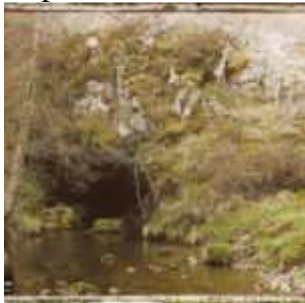
L'entrée de la grotte du Tuc d'Audoubert, Montesquieu-Avantès, Ariège, Midi-Pyrénées, France, 15 avril 1921, (Autochrome, 9 x 12 cm), Georges Chevalier, Département des Hauts-de-Seine, musée Albert-Kahn, Archives de la Planète, A 26 051 XS