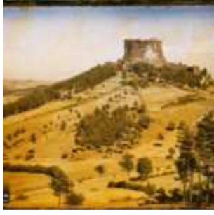
Murol, France, 20 juillet 1911, (Autochrome, ), Auguste Léon, Département des Hauts-de-Seine, musée Albert-Kahn, Archives de la Planète, A 6 265