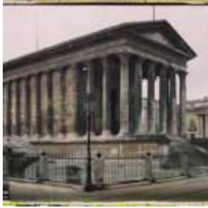
Nîmes, France, 13 avril 1916, (Autochrome, ), Auguste Léon, Département des Hauts-de-Seine, musée Albert-Kahn, Archives de la Planète, A 7 869