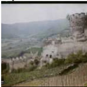
Kaysersberg, Haut-Rhin, Alsace, France, 25 mai 1921, (Autochrome, ), Georges Chevalier, Département des Hauts-de-Seine, musée Albert-Kahn, Archives de la Planète, A 27 392