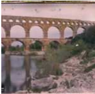
Beaucaire, France, 19 avril 1916, (Autochrome, ), Auguste Léon, Département des Hauts-de-Seine, musée Albert-Kahn, Archives de la Planète, A 8 153