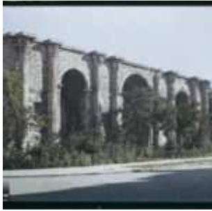
Reims, Marne, Champagne, France, 9 août 1919, (Autochrome, ), Fernand Cuville, Département des Hauts-de-Seine, musée Albert-Kahn, Archives de la Planète, A 16 993