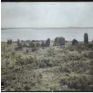
L'un des deux cromlechs d'Er Lannic, Er-Lanic, Morbihan, Bretagne, France, 21 avril 1924, (Autochrome, 9 x 12 cm), Georges Chevalier, Département des Hauts-de-Seine, musée Albert-Kahn, Archives de la Planète, A 41 093