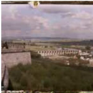
Le musée des Antiquités nationales, actuel musée d'archéologie nationale, Saint-Germain-en-Laye, France, Sans date, (Autochrome, ), opérateur non mentionné, Département des Hauts-de-Seine, musée Albert-Kahn, Archives de la Planète, A 211

Ailleurs en France, d'autres musées « d'antiquités » sont parfois photographiés, comme à Paris, Tours, La Rochelle, Arles, Le Puy, Cluny etc.