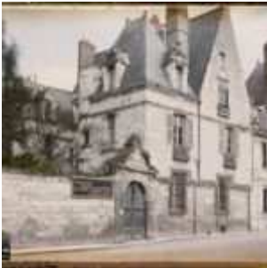
Tours, France, 3 avril 1928, (Autochrome, ), Auguste Léon, Département des Hauts-de-Seine, musée Albert-Kahn, Archives de la Planète, A 54 546