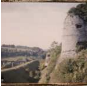
Les fossés ouest, vue prise vers le nord, Arques-la-Bataille, Seine-Maritime, Normandie, France, 11 septembre 1920, (Autochrome, 9 x 12 cm), Georges Chevalier, Département des Hauts-de-Seine, musée Albert-Kahn, Archives de la Planète, A 23 718