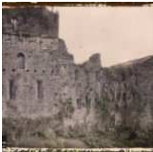
Sauveterre-de-Béarn, France, 4 octobre 1924, (Autochrome, ), Auguste Léon, Département des Hauts-de-Seine, musée Albert-Kahn, Archives de la Planète, A 44 843