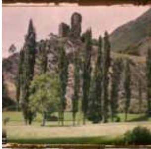
Environs de Luz-Saint-Sauveur, Hautes-Pyrénées, France, juillet 1921, (Autochrome, ), Fernand Cuville, Département des Hauts-de-Seine, musée Albert-Kahn, Archives de la Planète, A 30 528