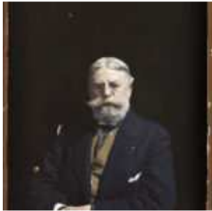
Le Comte Bégouën, Montesquieu-Avantès, Ariège, Midi-Pyrénées, France, 17 avril 1921, (Autochrome, 12 x 9 cm), Georges Chevalier, Département des Hauts-de-Seine, musée Albert-Kahn, Archives de la Planète, A 26 075 X