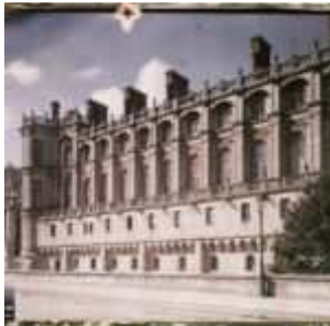
Le musée des Antiquités nationales, actuel musée d'archéologie nationale, Saint-Germain-en-Laye, France, Sans date, (Autochrome, ), opérateur non mentionné, Département des Hauts-de-Seine, musée Albert-Kahn, Archives de la Planète, A 207