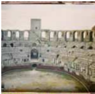
Arles, France, 15 avril 1916, (Autochrome, ), Auguste Léon, Département des Hauts-de-Seine, musée Albert-Kahn, Archives de la Planète, A 7 998