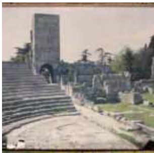
Arles, France, 15 avril 1916, (Autochrome,)

Les diverses missions dans les régions françaises, entre 1916 et 1924 essentiellement, amènent les photographes à documenter les vestiges antiques en élévation les plus marquants dans le paysage. Les grands sites du Sud-Est de la France sont bien sûr représentés. Ce sont les amphithéâtres, théâtres, aqueducs ou temples d'Arles, de Nîmes, Nice (Cimiez), Fréjus, Vers-Pont-du-Gard, etc. Compte tenu de la qualité de leurs vestiges, les villes de Nîmes et d'Arles sont spécifiquement couvertes pour l'archéologie lors de la mission « Jean Brunhes, Auguste Léon et Georges Chevalier dans les provinces françaises en 1916 », avec au moins 45 clichés archéologiques pour la première, 14 pour la seconde. Mais c'est l'ensemble du territoire français qui est marqué par des constructions antiques monumentales préservées . Les autochromes en rendent compte à travers quelques exemples : Autun, Bordeaux, Cahors, Saintes, Reims, ou Guingamp.