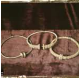
Toulouse, France, 25 avril 1921, (Autochrome, ), Georges Chevalier, Département des Hauts-de-Seine, musée Albert-Kahn, Archives de la Planète, A 26 171