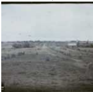
Les alignements de Kermario, Carnac, Morbihan, Bretagne, France, 14 juin 1920, (Autochrome, 9 x 12 cm), Georges Chevalier, Département des Hauts-de-Seine, musée Albert-Kahn, Archives de la Planète, A 21 858