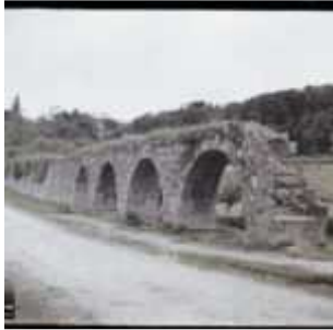
Vestiges de l'aqueduc romain de Guingamp, Guingamp, Côtes-du-Nord, Bretagne, France, 30 mai 1920, (Autochrome, 9 x 12 cm), Georges Chevalier, Département des Hauts-de-Seine, musée Albert-Kahn, Archives de la Planète, A 21 616