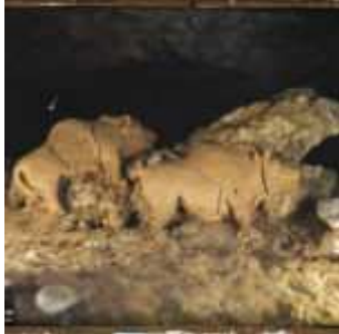
Les bisons d'argile, Montesquieu-Avantès, Ariège, Midi-Pyrénées, France, 15 avril 1921, (Autochrome, 9 x 12 cm), Georges Chevalier, Département des Hauts-de-Seine, musée Albert-Kahn, Archives de la Planète, A 26 058