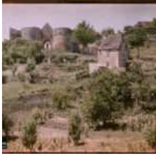
Domme, Dordogne, France, 15 juin 1916, (Autochrome, ), Auguste Léon, Département des Hauts-de-Seine, musée Albert-Kahn, Archives de la Planète, A 8 941