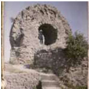
Thann, Haut-Rhin, Alsace, France, 25 juillet 1920, (Autochrome, ), Auguste Léon, Département des Hauts-de-Seine, musée Albert-Kahn, Archives de la Planète, A 22 886