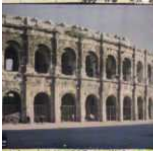
Nîmes, France, 14 avril 1916, (Autochrome, ), Auguste Léon, Département des Hauts-de-Seine, musée Albert-Kahn, Archives de la Planète, A 7 887