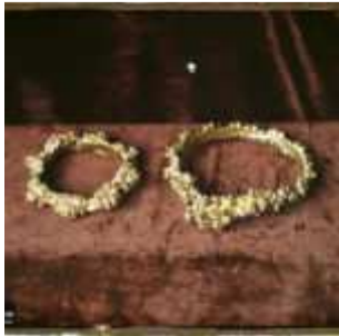
Toulouse, France, 25 avril 1921, (Autochrome, ), Georges Chevalier, Département des Hauts-de-Seine, musée Albert-Kahn, Archives de la Planète, A 26 172