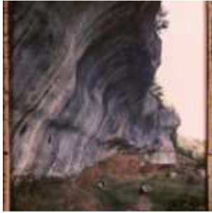
Abri de Laussel, Marquay, Dordogne, France, 14 juin 1916, (Autochrome, ), Georges Chevalier, Département des Hauts-de-Seine, musée Albert-Kahn, Archives de la Planète, A 8 927