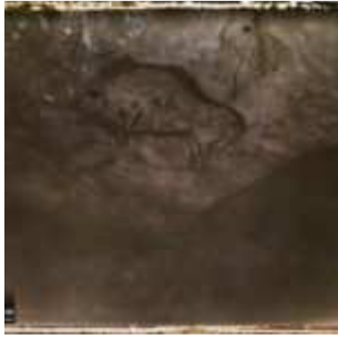
Grotte de Niaux : le bison avec le signe rouge, Niaux, Ariège, Midi-Pyrénées, France, 7 octobre 1921, (Autochrome, 9 x 12 cm), Georges Chevalier, Département des Hauts-de-Seine, musée Albert-Kahn, Archives de la Planète, A 29 073