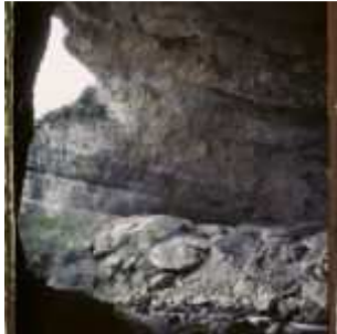
L'orifice avec l'échancrure supérieure, vu de l'intérieur, Mas-d'Azil [Le], Ariège, Midi-Pyrénées, France, 14 avril 1921, (Autochrome, 12 x 9 cm), Georges Chevalier, Département des Hauts-de-Seine, musée Albert-Kahn, Archives de la Planète, A 26 045