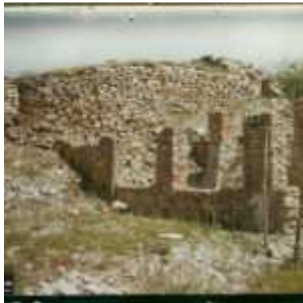
Luzech, France, 19 juin 1916, (Autochrome, ), Georges Chevalier, Département des Hauts-de-Seine, musée Albert-Kahn, Archives de la Planète, A 9 137