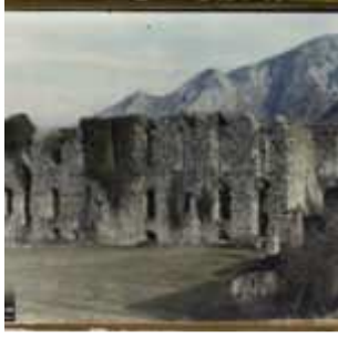
Les ruines de l'ancienne abbaye de Sospel, Sospel, France, février 1923, (Autochrome, ), Roger Dumas, Département des Hauts-de-Seine, musée Albert-Kahn, Archives de la Planète, A 38 474