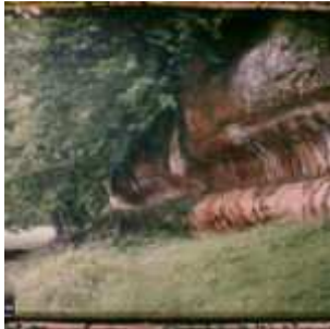
Grotte de la Madeleine, Tursac, Dordogne, France, 14 juin 1916, (Autochrome, ), Georges Chevalier, Département des Hauts-de-Seine, musée Albert-Kahn, Archives de la Planète, A 8 915