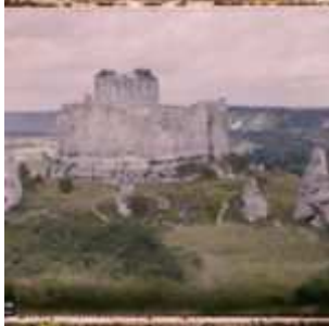
Le Château Gaillard, vu d'ensemble vers la Seine, Les Andelys, Eure, Normandie, France, 3 juillet 1920, (Autochrome, 9 x 12 cm), Georges Chevalier, Département des Hauts-de-Seine, musée Albert-Kahn, Archives de la Planète, A 22 473 S