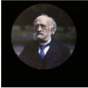
Toulouse, France, 25 avril 1921, (Autochrome, ), Georges Chevalier, Département des Hauts-de-Seine, musée Albert-Kahn, Archives de la Planète, A 26 160