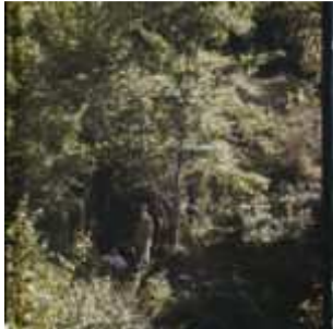
Montespan, France, 1 octobre 1923, (Autochrome, ), Georges Chevalier, Département des Hauts-de-Seine, musée Albert-Kahn, Archives de la Planète, A 39 174