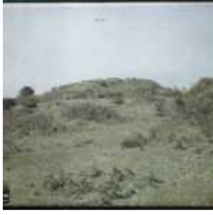
Le tumulus de Gavrinis, Environs de Locmariaquer, Morbihan, Bretagne, France, 21 avril 1924, (Autochrome, 9 x 12 cm), Georges Chevalier, Département des Hauts-de-Seine, musée Albert-Kahn, Archives de la Planète, A 41 110