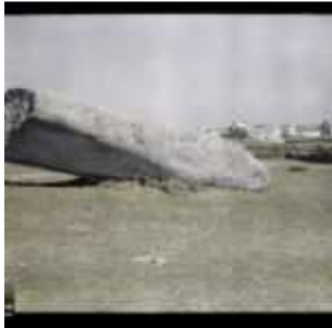
Le plus gros des quatre fragments du Grand Menhir brisé ; à l'arrière-plan, le village de Locmariaquer, Locmariaquer, Morbihan, Bretagne, France, 21 avril 1924, (Autochrome, 9 x 12 cm), Georges Chevalier, Département des Hauts-de-Seine, musée Albert-Kahn, Archives de la Planète, A 41 098