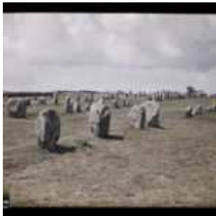
Alignements du Méneac, Carnac, Morbihan, Bretagne, France, 14 juin 1920, (Autochrome, 9 x 12 cm), Georges Chevalier, Département des Hauts-de-Seine, musée Albert-Kahn, Archives de la Planète, A 21 837