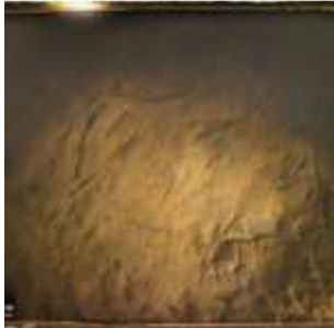
, Montespan, France, 29 septembre 1923, (Autochrome, ), Georges Chevalier, Département des Hauts-de-Seine, musée Albert-Kahn, Archives de la Planète, A 39 130