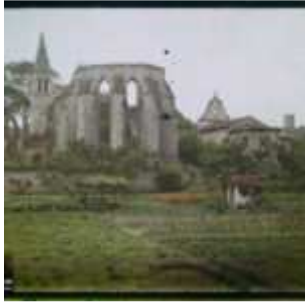
Cahors, France, 20 juin 1916, (Autochrome, ), Georges Chevalier, Département des Hauts-de-Seine, musée Albert-Kahn, Archives de la Planète, A 9 162