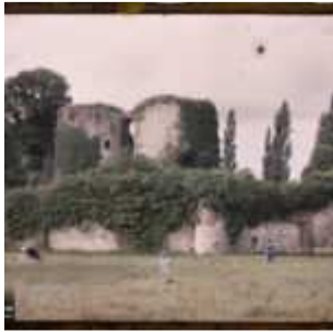
Blanquefort, France, juin 1920, (Autochrome, ), Fernand Cuville, Département des Hauts-de-Seine, musée Albert-Kahn, Archives de la Planète, A 27 374