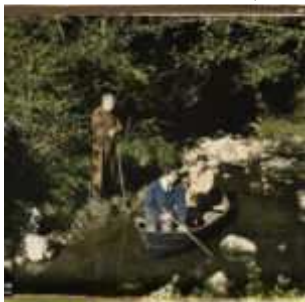
Le comte Begouën et deux de ses fils dans la barque, Montesquieu-Avantès, Ariège, Midi-Pyrénées, France, 26 septembre 1921, (Autochrome, 9 x 12 cm), Georges Chevalier, Département des Hauts-de-Seine, musée Albert-Kahn, Archives de la Planète, A 28 938