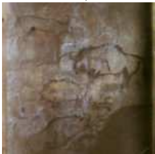
Grotte de Niaux : quatrième panneau, partie droite, Niaux, Ariège, Midi-Pyrénées, France, 7 octobre 1921, (Autochrome, 12 x 9 cm), Georges Chevalier, Département des Hauts-de-Seine, musée Albert-Kahn, Archives de la Planète, A 29 071