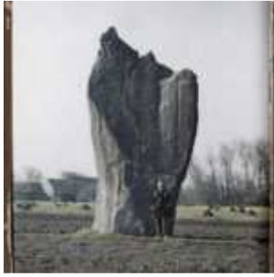
Devant l'un des deux menhirs de Kerscaven, dit le menhir de l'Evêque, un homme pose pour indiquer l'échelle du mégalithe, Penmarch, Finistère, Bretagne, France, 3 mars 1920, (Autochrome, 12 x 9 cm), Georges Chevalier, Département des Hauts-de-Seine, musée Albert-Kahn, Archives de la Planète, A 20 317 S