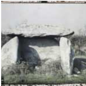
Le dolmen de Menez-Lann-Du, Plomeur, Finistère, Bretagne, France, 3 mars 1920, (Autochrome, 9 x 12 cm), Georges Chevalier, Département des Hauts-de-Seine, musée Albert-Kahn, Archives de la Planète, A 20 322 S