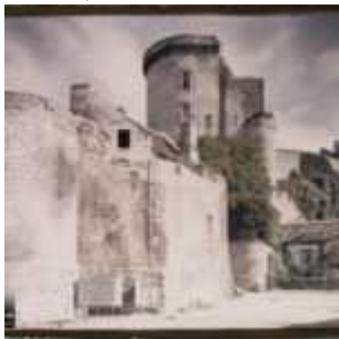
Loches, France, Sans date, (Autochrome, ), opérateur non mentionné, Département des Hauts-de-Seine, musée Albert-Kahn, Archives de la Planète, A 224