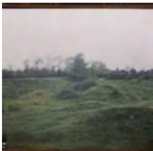
Aspect du terrain pour déterminer l'emplacement des fossés doubles du château fort de Maisy, Environs de Grandcamp-Maisy, Calvados, Normandie, France, 16 mai 1921, (Autochrome, 9 x 12 cm), Roger Dumas, Département des Hauts-de-Seine, musée Albert-Kahn, Archives de la Planète, A 26 393 S

Parfois indexés avec le terme « archéologie » ou l'expression « vestige archéologique », les autochromes des ruines d'édifices médiévaux parsèment la collection des Archives de la Planète. Au gré des missions, des centres d'intérêt des photographes puis de l'enregistrement des clichés, les monuments ou vestiges sont documentés dans la collection. Les prises de vue sur cette thématique patrimoniale concernent bien logiquement toute la France . Les exemples pris ci-dessous sur l'ensemble du territoire en témoignent : châteaux de Grandcamp-Maisy (Calvados), Arques (Seine-Maritime), Château-Gaillard (Eure), Thann et Kayserberg (Haut-Rhin), Murol (Puy-de-Dôme), Sospel (Alpes-Maritimes), Luz-Saint-Sauveur (Hautes-Pyrénées), Sauveterre-de-Béarn (Pyrénées-Atlantiques), Domme (Dordogne), Cahors (Lot), Blanquefort (Gironde), Loches (Indre-et-Loire) et Guérande (Loire-Atlantique).