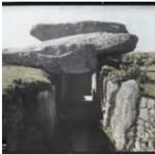
Le couloir d'entrée du dolmen de la Table des Marchand, Environs de Locmariaquer, Morbihan, Bretagne, France, 21 avril 1924, (Autochrome, 9 x 12 cm), Georges Chevalier, Département des Hauts-de-Seine, musée Albert-Kahn, Archives de la Planète, A 41 108