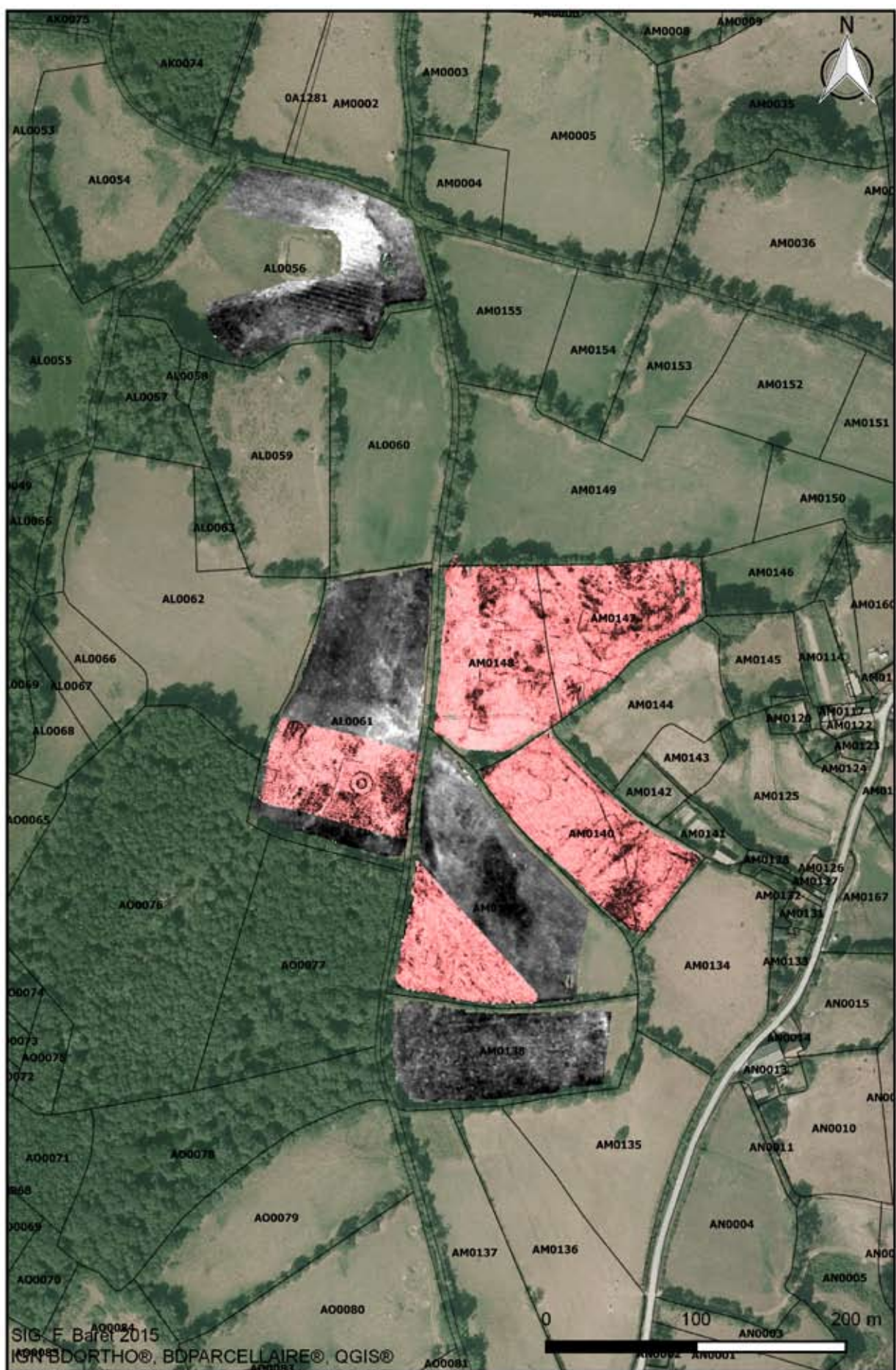
Fig. 2 : Les Montceaux (Ladapeyre, 23) : cartographie des parcelles prospectées en géophysique en 2012 (ARP : nuances de gris) et 2014 (Radar : nuance de rose) – SIG F. Baret 2015