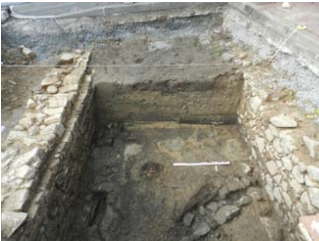
Fig. 1 : vue d'ensemble du sondage parking de la crèche en cours de fouille.

Les emplacements du parking Bordier et de la rue George-Sand se sont révélés négatifs en vestige archéologique. Pour le premier, le substrat a été rencontré vers 1,30 m après avoir retiré des remblais récents et pour le second, le substrat n'a pas été atteint et seuls des remblais ont été observés.