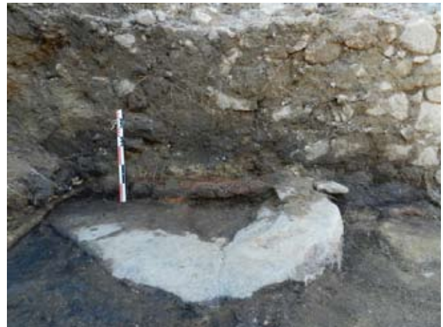
Fig. 2 : le foyer avec son âtre contre une maçonnerie.

Les investigations menées à l'intersection de la rue Ferrague et de la rue Ingres ont permis d'appréhender de nombreuses maçonneries dont certaines constituaient deux caves récentes. Le dernier sondage, effectué à l'autre extrémité de la rue Ingres, a révélé un niveau de circulation (pavement en granit) et les restes d'une maçonnerie qui pourrait être les vestiges du rempart de la ville.