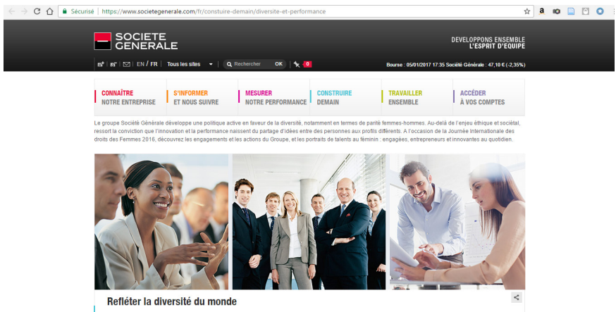
Figure 4 : Site de la Société Générale : onglet « Construire demain », rubrique « Diversité et performance », sous-rubrique « Refléter la diversité du monde »