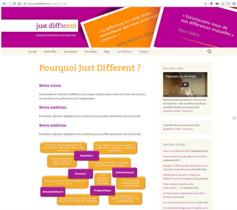
Figure 6 : Page du site de l'agence « Just Différent, conseil et formation en diversité » : onglet « Just Différent », rubrique « Pourquoi Just Different ? » Source : http://www.justdifferent.eu/?page_id=198

Ce management, dans sa visée gestionnaire, requalifie toutes les problématiques sociétales en problématiques économiques de « performances » (comme on peut le voir dans la figure ci-dessus). Par exemple, aux Etats-Unis : « Le nouveau discours de la diversité, diffusé par une abondante littérature d'entreprise, procède en repoussant les dimensions juridiques et morales des politiques antidiscriminatoires pour les remplacer par un discours sur l'efficacité économique ( business case ) de ces politiques, censées offrir aux entreprises un avantage comparatif. Ce processus d'appropriation managériale est passé par une redéfinition du contenu des politiques antidiscriminatoires menées antérieurement. [...] Alors que certaines "différences" entre les individus, liées à leur appartenance ou non à certains groupes protégés par le droit, étaient prises en compte par les politiques d' affirmative action de manière provisoire dans le but de réparer les injustices subies, elles sont désormais reconnues et célébrées pour leur contribution 23 à la performance de l'entreprise. » (Bereni, 2009 : 91).