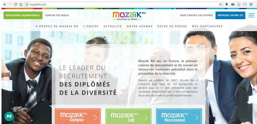
Figure 5 : « Mozaik RH : diversifiez vos talents / Le leader du recrutement des diplômés de la diversité »

Nous repérons des formes sémiotiques récurrentes dans les visuels qui accompagnent la thématique de « la diversité ». Il s'agit principalement du format « trombinoscope » (ou mosaïque de portraits), parfois couplé avec différentes formes multicolores plus ou moins figuratives 20 .