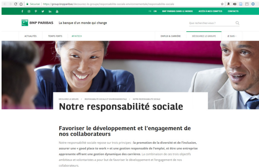
Figure 3 : Site d'AXA : onglet « Découvrez le Groupe », rubrique « Responsabilité sociale et environnementale », sous-rubrique « Notre responsabilité sociale »

plurielle », comme en témoigne le débat autour des « statistiques ethniques » (de Rudder & Vourc'h, 2006).