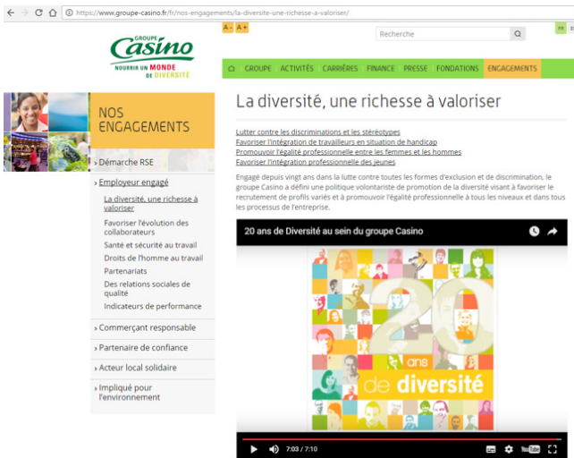
Figure 1 : Sous-rubrique « La diversité, une richesse à valoriser »

consacrées à la démarche RSE qu'aux thématiques de l'emploi et du recrutement. Par exemple, chez Casino , la diversité est tout d'abord mentionnée à l'onglet « Nos engagements », dans la rubrique « Démarche RSE » qui présente les différents pôles de cette démarche dont le premier est « Employeur engagé » avec pour premier objectif cité : « promouvoir la diversité » 17 ; objectif que l'on retrouve ensuite décliné à la rubrique « Employeur engagé » dans la sous-rubrique « La diversité, une richesse à valoriser », qui comprend sur la même page quatre parties respectivement intitulées : « Lutter contre les discriminations et les stéréotypes », « Favoriser l'intégration de travailleurs en situation de handicap », « Promouvoir l'égalité professionnelle entre les femmes et les hommes » et « Favoriser l'intégration professionnelle des jeunes ».