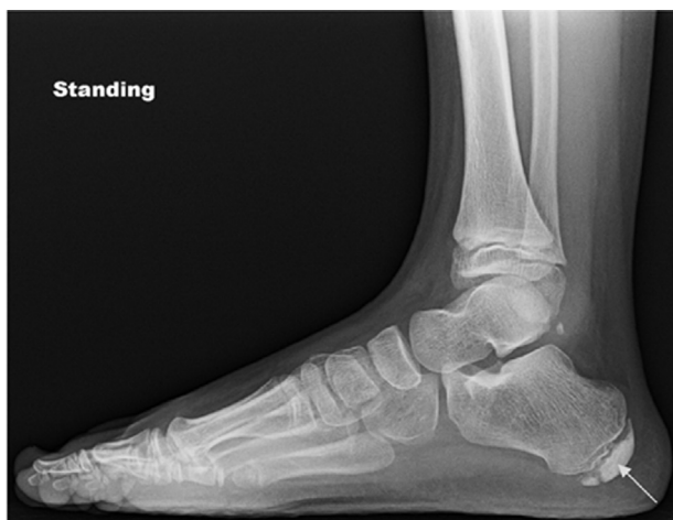
Figure 2 Vue latérale au rayon-X d'un pied présentant une maladie de Sever identifiable par la fragmentation de l'apophyse calcanéenne (illustration utilisée avec la permission de Chang et al., 2013 [109]).