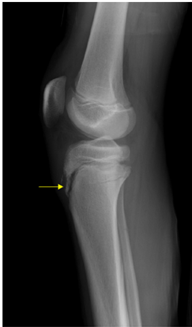
Figure 3 Vue latérale au rayon-X d'un genou présentant une maladie d'Osgood-Schlatter identifiable par la fragmentation de la tubérosité tibiale (illustration utilisée avec la permission de Chang et al., 2013 [109]).

angulaires du tibia, un quadriceps raide et/ou un déséquilibre entre les fléchisseurs et les extenseurs du genou sont des facteurs ayant aussi été associés au développement de cette pathologie [58].