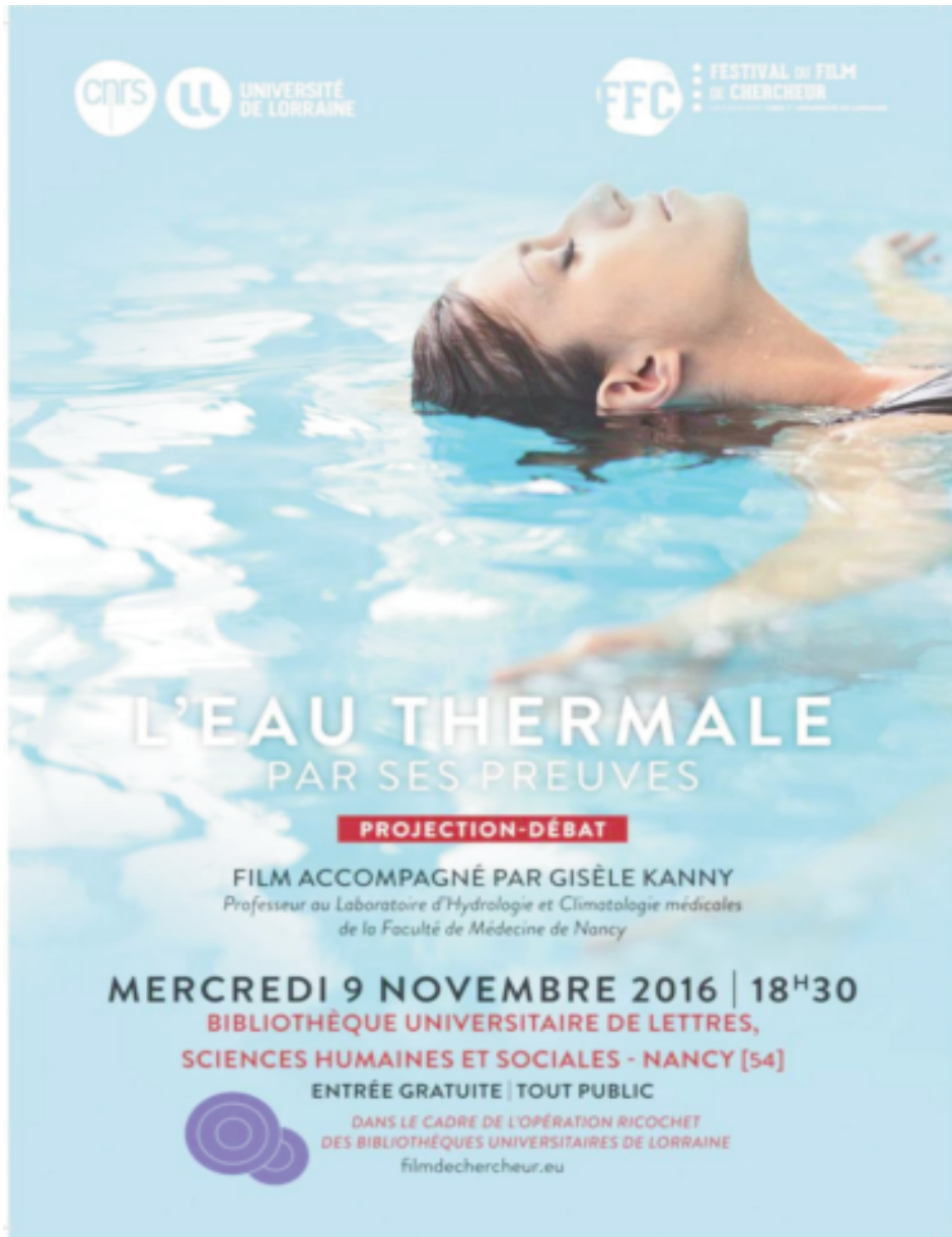
Figure 6 : Flyer pour la soirée-débat