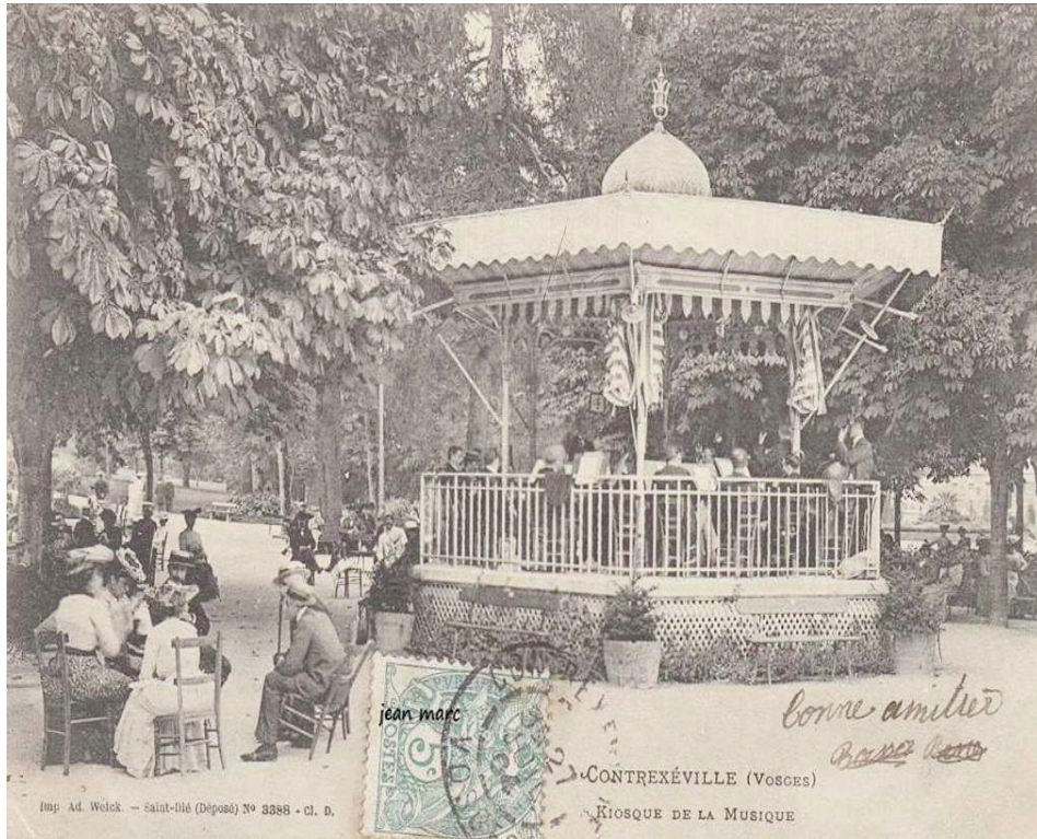
Figure 2 : Kiosque de Contréxéville

coute de morceaux choisis et joués à Vittel (voir figure 3).