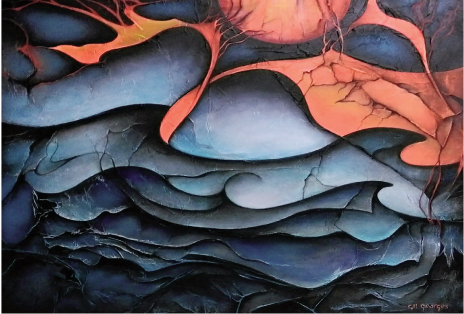
Figure 5 : Peinture de Gil George

“En prise avec le passé pour inventer le futur” 3 fut l'état d'esprit des quatre sociétaires de l'Association des Artistes lorrains pour concevoir leurs compositions artistiques. Les peintures sont de Violette Costet, enseignante en arts plastiques, de Gil Georges, artiste