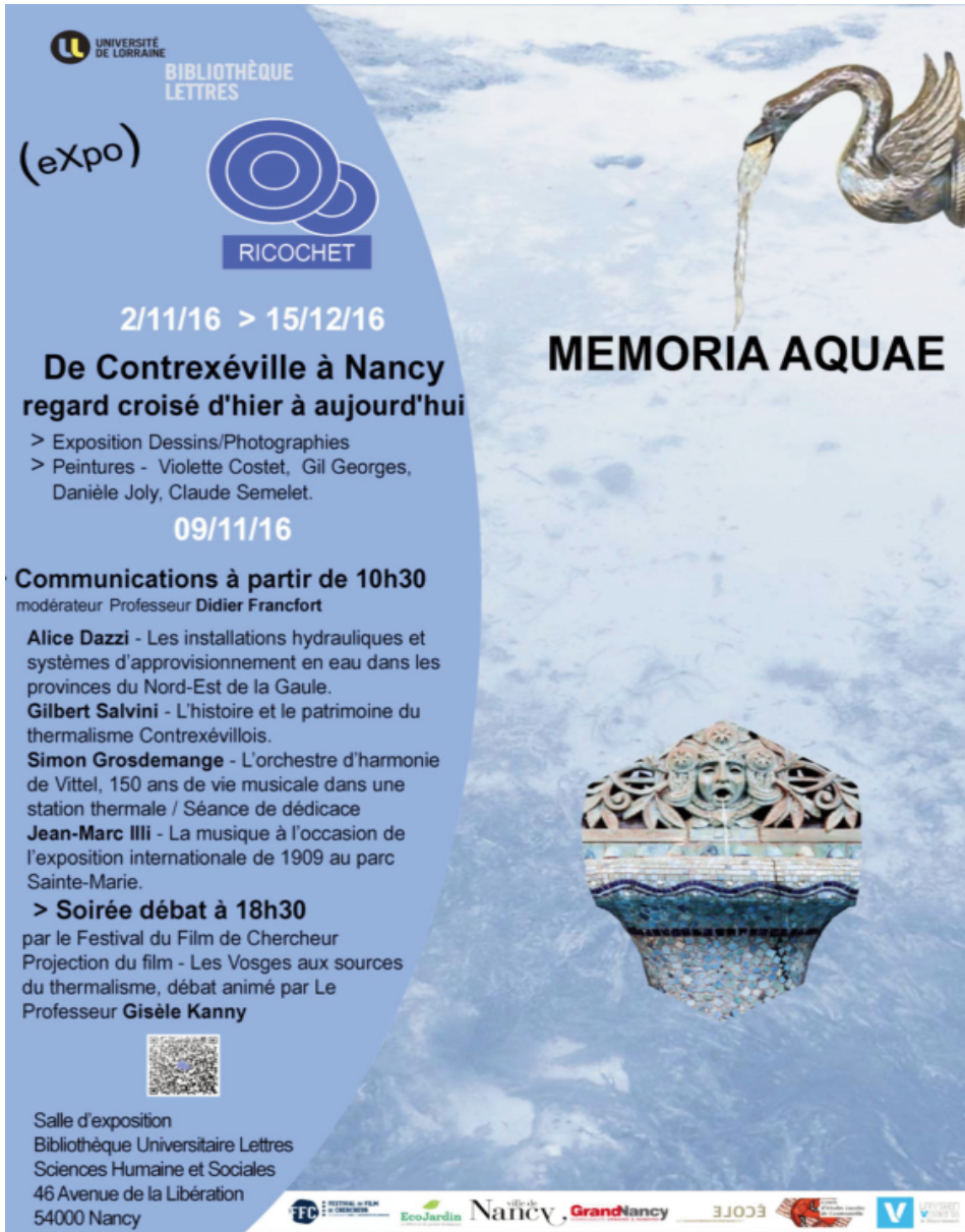
Figure 1 : Affiche de l'exposition Memoria Aquae

La mission Animation culturelle de la direction de la Documentation et de l'édition a pour mission la diffusion des cultures scientifiques et artistiques auprès de ses publics.