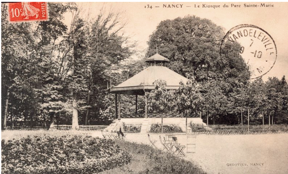
Figure 4 : Kiosque du Parc Sainte-Marie

“Ainsi, L'Académie nationale de médecine donne un AVIS FAVORABLE à l'exploitation du forage F4 comme eau minérale naturelle dans l'indication Rhumatologie (RH)”.