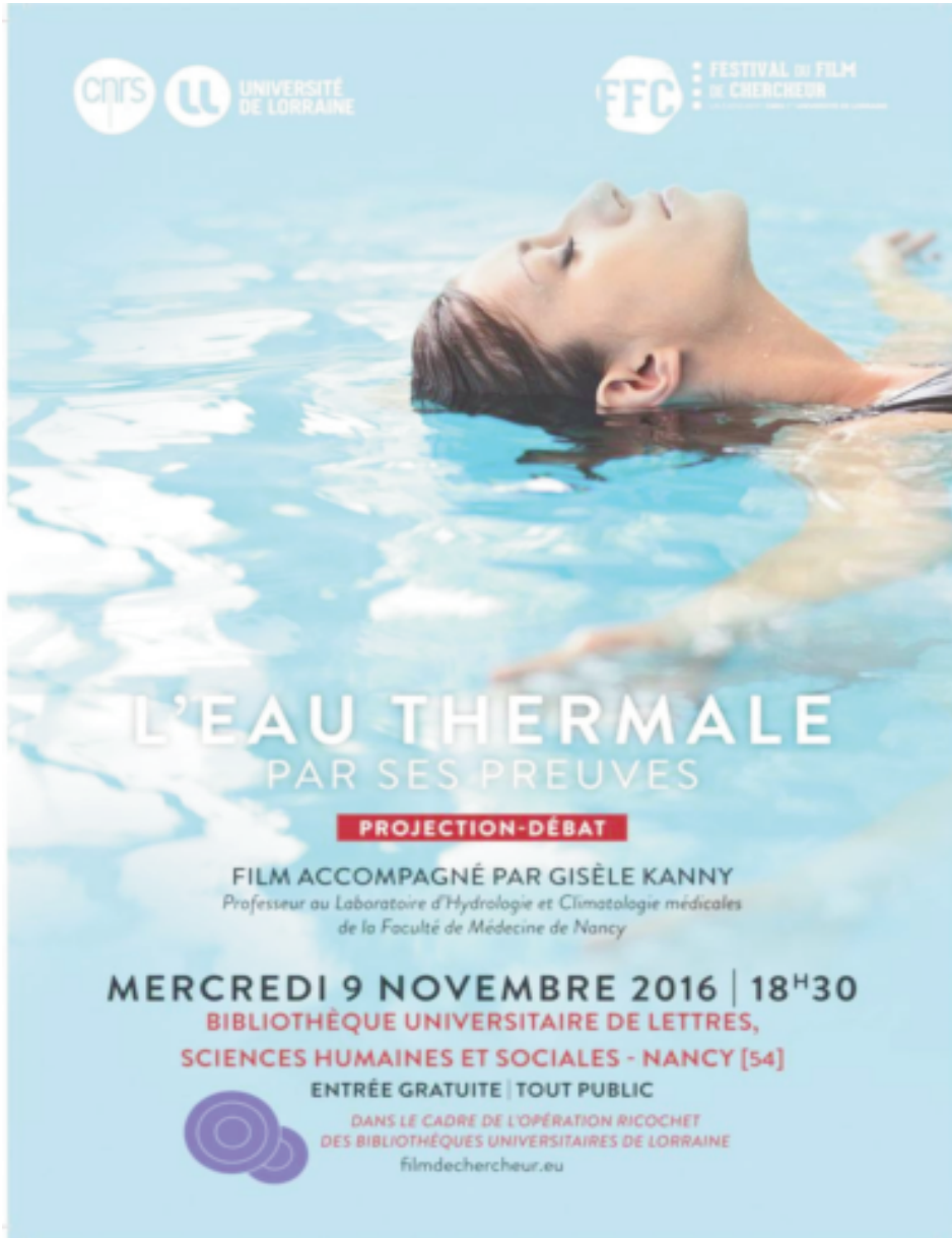
Figure 6 : Flyer pour la soirée-débat