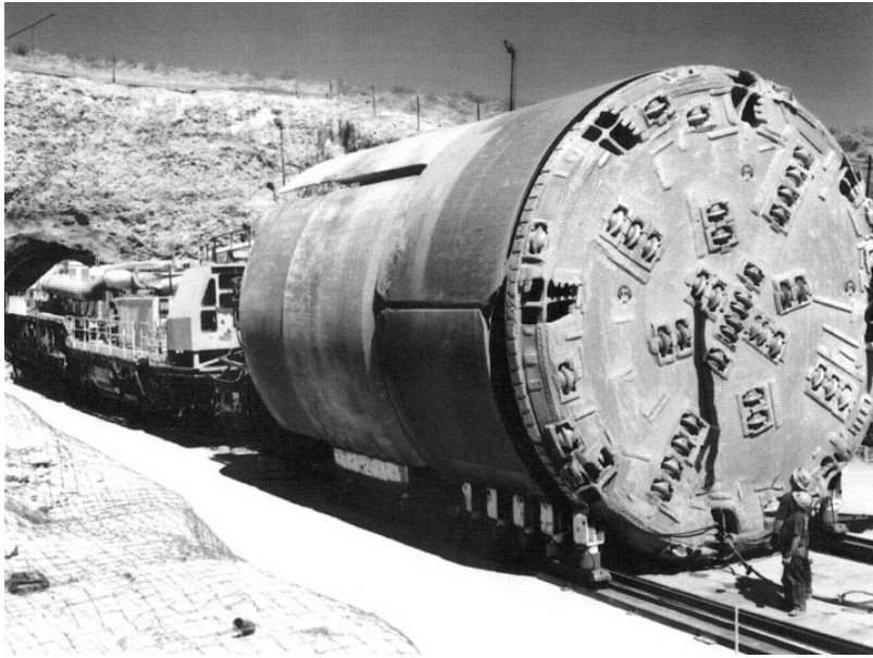
FIGURE 1: Photo d'un tunnelier

Dans le cadre de l'étude, nous nous sommes focalisés sur deux types de support :