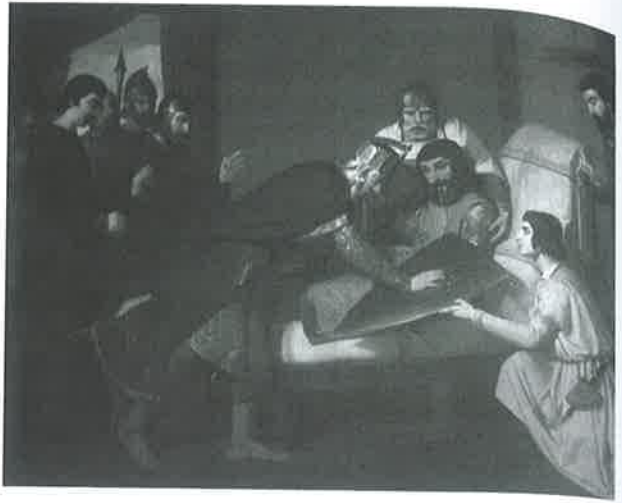
Figure 1 – Claudio Lorenzale, Guifré el Pelós , 1844. Museu d'Art Modern de Barcelona.

origines de cet écu sur lesquelles nous ne reviendrons pas 4 . Cet emblème est donc beaucoup plus ancien que celui de la nation espagnole, le drapeau Rojo y Gualda , qui trouve ses origines dans la nécessité de doter la marine d'un drapeau visible et reconnaissable. Différent du drapeau blanc des Bourbons qui pouvait être confondu avec celui d'autres pays régis par la même maison, comme la France ou le Royaume de Naples, le drapeau rojigualda est défini par le décret du 28 mai 1785 en tant que bandera nacional . Les couleurs de la marine royale de guerre furent bientôt étendues aux places maritimes à partir de 1793. Les modèles présentés au roi furent d'une grande variété et la visibilité fut le critère déterminant mais peut-être le monarque ne fut-il pas insensible au fait que le drapeau rojigualda reprenait les couleurs des Quatre Barres de la Couronne d'Aragon.