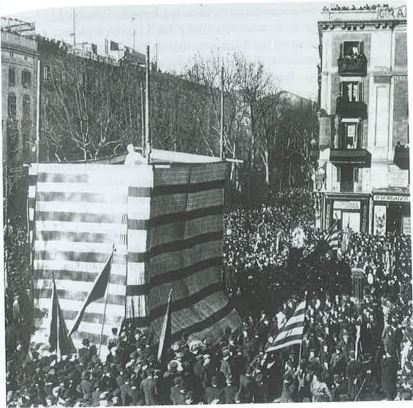
Figure 10 – Inauguration du monument à Pitarra (Frederic Soler), 1906.

sacrée que dessinent les cordons et les policiers. En ce sens, les couleurs participent de l'instauration d'un ordre sacré qui est un ordre social.