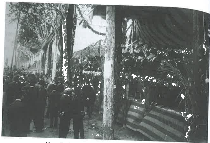
Figure 7 -- Acte politique de Solidaritat Catalana , 1906.

C'est également le sens que revêt l'immense Senyera qui est le personnage principal du monument au Docteur Robert, élaboré entre 1901 et 1910 (figure 8). Lors de son inauguration, place de l'Université à Barcelone, le thème de la Senyera déclencha une polémique politique importante qui révélait les résistances sociales à un usage catalaniste des couleurs catalanes 19 . Pour représenter le soi-disant martyr du Dr Robert, l'un des premiers militants nationalistes et ancien maire de Barcelone décédé en 1901, le sculpteur moderniste Josep Llimona fit du drapeau l'un des thèmes principaux du gigantesque monument. Tenue par le génie de la poésie, une Senyera de bronze se déployait largement en épousant les contours du rocher qui comportait de multiples personnages allégoriques. Parmi ces derniers, la figure de Verdaguer lisait la bonne nouvelle de la libération de la Catalogne à un ouvrier et un faucheur ( el segador , en catalan). Véritable trait d'union entre les scènes, la Senyera était coiffée par la croix de Sainte Eulalie, sainte patronne de Barcelone. En conséquence de la polémique soulevée par ce monument, le Gouverneur civil de la province de Barcelone interdit d'arborer la Senyera ou tout autre couleur politique, même s'il autorisait les enseignes des associations 20 . L'hostilité à la Senyera du monument au Docteur Robert demeura si ancrée qu'en 1940, le franquisme démonta l'édifice et