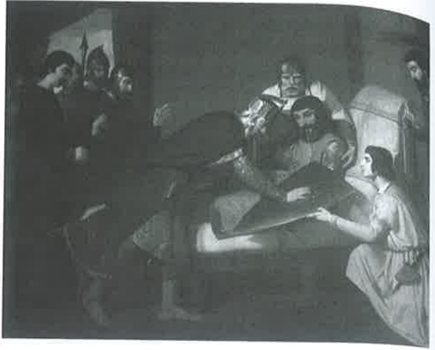
Figure 1 – Claudio Lorenzale, Guifré el Pelós , 1844. Museu d'Art Modern de Barcelona.

origines de cet écu sur lesquelles nous ne reviendrons pas 4 . Cet emblème est donc beaucoup plus ancien que celui de la nation espagnole, le drapeau Rojo y Gualda , qui trouve ses origines dans la nécessité de doter la marine d'un drapeau visible et reconnaissable. Différent du drapeau blanc des Bourbons qui pouvait être confondu avec celui d'autres pays régis par la même maison, comme la France ou le Royaume de Naples, le drapeau rojigualda est défini par le décret du 28 mai 1785 en tant que bandera nacional . Les couleurs de la marine royale de guerre furent bientôt étendues aux places maritimes à partir de 1793. Les modèles présentés au roi furent d'une grande variété et la visibilité fut le critère déterminant mais peut-être le monarque ne fut-il pas insensible au fait que le drapeau rojigualda reprenait les couleurs des Quatre Barres de la Couronne d'Aragon.