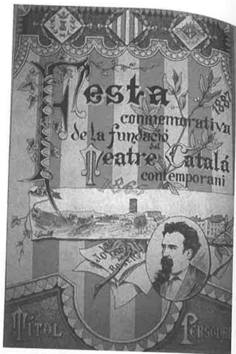
Figure 6 – Viuda de Padro y R. Cabot, affiche publicitaire.