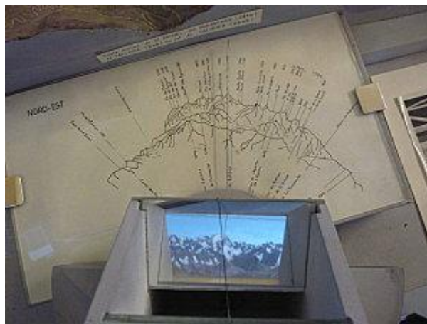
(la Barre des Ecrins, plus haut sommet du massif, -4102 mètres- vue dans le miroir)

Oui, mais nos officiers sont des personnes exigeantes et ils ajoutent une condition. Ils veulent voir les sommets, non pas de dessus, mais comme s'ils étaient sur les sentiers, en train d'admirer des panoramas à couper le souffle, avec le jeu des montagnes se cachant les unes les autres. Une problématique récurrente en géographie, notons-le. Ils vont alors construire un astucieux système de miroirs, utilisant la technique du périscope, que l'on peut orienter à loisir dans toutes les directions.