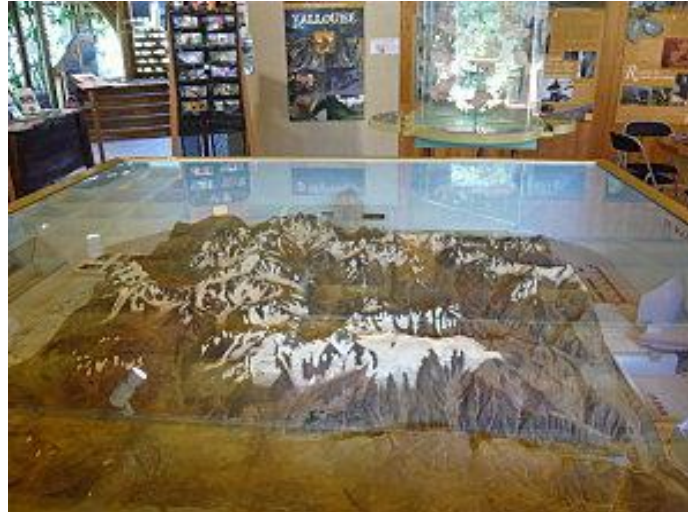
La carte (à son emplacement en 2010)

Oui, mais nos officiers sont des personnes exigeantes et ils ajoutent une condition. Ils veulent voir les sommets, non pas de dessus, mais comme s'ils étaient sur les sentiers, en train d'admirer des panoramas à couper le souffle, avec le jeu des montagnes se cachant les unes les autres. Une problématique récurrente en géographie, notons-le. Ils vont alors construire un astucieux système de miroirs, utilisant la technique du périscope, que l'on peut orienter à loisir dans toutes les directions.