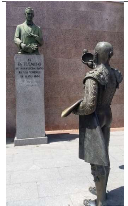
Image 9 : statue à la gloire de l'inventeur de la pénicilline, devant les arènes de Madrid

Les autorités sont attentives à ce que les risques pour l'homme restent forts mais les progrès de la médecine tendent à limiter les issues mortelles.