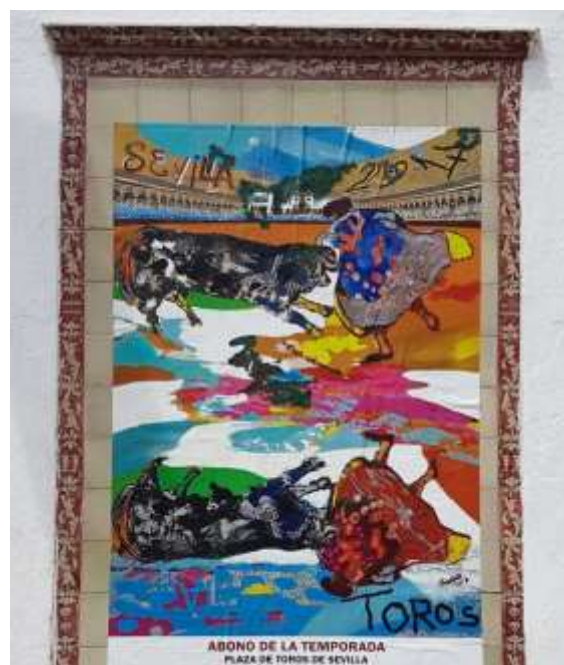
Image 11 : sur cette image d'affiche de « feria » sur un mur de Séville, le reflet montre un taureau et un torero renversés, ce dernier étant revêtu couleur sang

« Ce que met en scène la corrida, c'est peut-être l'ajustement, l'alignement, la recherche d'un accord entre deux acteurs de Grotowski, deux artistes du dévoilement, deux servants du sacrifice tauromachique : le taureau et le torero » (Roux, 2011, p. 150-151).