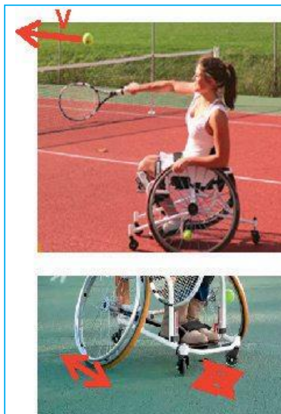
Avec l'accord de la joueuse de tennis

Assez rapidement, il est ressorti qu'il existe un mouvement de « twist » du fauteuil, et un mouvement de recul. Ces mouvements limitent la puissance de la balle en « consommant » de la puissance de la joueuse lors du service. Les étudiants ont alors continué l'observation en bloquant la rotation d'une, puis des deux petites roues situées à l'avant du fauteuil, qui servent principalement à orienter le fauteuil (voir photos).